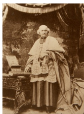
Anonyme, Portrait d'un prélat , années 1880

Cette tradition des grands portraits solennels s'est perpétuée jusqu'à l'époque actuelle, sous des formes variables selon les personnages représentés, les modes du temps, l'évolution de la société, le médium utilisé, etc. En voici quelque exemples récents, pris dans le registre photographique :