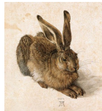
Albrecht Dürer, Lièvre , 1502