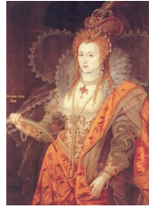
Isaac Oliver, Rainbow portrait , 1600

L'exemple des portraits d'Élisabeth I er révèle l'alchimie complexe de la royauté, résumée sous l'expression : « les deux corps du roi ». Selon des légistes anglais de l'époque :