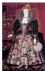
Nicholas Hilliard et son atelier, Hardwick portrait , 1599

« Les peintres multiplièrent à son intention les 'portraits-culte', purs symboles de la Majesté agrémentés d'une formidable prodigalité de détails. Le portrait 'Ditchley' en est le meilleur exemple ». (Gaunt, 1993 : 21)