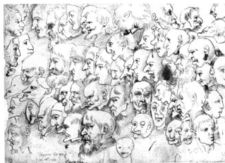
Augustin Carrache, Feuille de caricatures , vers 1594

« Se dit, écrivait un expert de l'époque, d'une manière qu'ont les peintres et les sculpteurs de faire des portraits aussi ressemblants que possible ; mais, par jeu et parfois par raillerie, en aggravant ou en augmentant hors de toute proportion les défauts de la personne représentée, de telle façon que, vus dans leur ensemble, ils paraissent refléter la vérité, alors que dans les détails ils s'en écartent. »