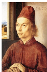
Dirk Bouts, Portrait d'homme , 1462

Dirk Bouts aurait été le premier peintre à proposer ainsi un portrait d'homme sans plus aucun prétexte religieux (Verhaegen, 1976 : 28). Ce mode de représentation formalisait une représentation symbolique de l'Homme dans son for intérieur, tel qu'en lui-même, mais avec une ouverture sur le monde. Symbolique humaniste par excellence.