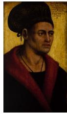
Jan Polack, Portrait du duc Sigismond de Bavière, 1491

Exemples pris dans le livre de Naïma Ghermani (2009) qui illustrent cette évolution :