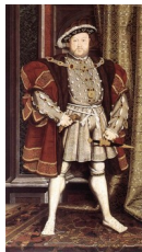
Hans Holbein le jeune, Portrait d'Henry VIII , 1539-1540

L'intention politique était évidente au moment où ce roi rejetait le pouvoir du pape pour se proclamer seul chef de l'Église anglaise.