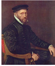
Antonio Moro, Portrait de sir Thomas Gresham, vers 1560: il s'agissait de l'ambassadeur d'Angleterre auprès de Marguerite de Parme