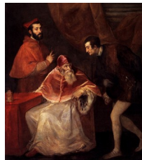
Titien, Paul III et ses petits-fils Alessandro et Ottavio Farnese , 1546 : même type de scène, semi-privée

Les deux derniers sont des portraits collectifs, montrant le pape entouré de ses plus proches conseillers. Chaque fois, l'un d'eux enserme le dossier du trône pontifical avec ses deux mains, signifiant ainsi sa position de confident direct du pape. On sait précisément qui ils étaient et quelle était la signification politique de leur présence sur le tableau. Mais, tandis que chez Raphaël, ils « posent, impassibles, comme des acteurs muets, communiquant à peine les uns avec les autres », chez Titien, ils apparaissent engagés dans une interaction beaucoup plus étroite. Cette intensité visible a autorisé certains historiens à voir dans ce dernier tableau « peut-être le plus grand portrait psychologique de tous les temps » ; tandis que d'autres le considèrent comme « peut-être le document politique le plus extraordinaire que nous ait légué la peinture occidentale moderne ». Ces deux modes d'appréciation sont également possibles, alors que le tableau peint par Raphaël est, quant à lui, ouvertement « un portrait officiel, qui montre le pouvoir absolu du pape, même dans une occupation en apparence privée » (la contemplation d'une bible richement enluminée) (Schneider, 1994 : 96).