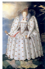
Marcus Gheeraerts le jeune, Ditchley portrait , vers 1593

Dans ce dernier portrait, la reine est montrée debout sur son royaume, dans une « solennité quasi byzantine ».