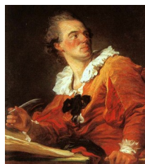
Fragonard, L'inspiration , vers 1769