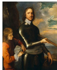
Robert Walker, Portrait de Cromwell , vers 164

« En fait, pour blâmable qu’elle soit sur le plan artistique, la pratique était courante : on considérait les corps et les attitudes comme un patrimoine exploitable à merci. Il suffisait de changer la tête. » (Gaunt, 1993 : 40)