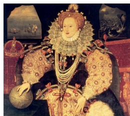
Élisabeth I er devant l'Armada espagnole, par un artiste inconnu, 1588

Autre exemple intéressant, toujours à la cour d'Angleterre : les portraits d'Élisabeth I er . Ici, la force ne saurait être l'attribut mis en avant. Le costume prend alors le relais : lourd, fastueux à l'extrême, il transforme la reine en une sorte d'idole et fait oublier qu'elle est une femme, ce qui n'était pas une qualité pour l'époque. Son corps disparaît littéralement sous le costume royal, qui apparaît comme l'insigne qui fait d'elle une reine et non pas une simple femme.