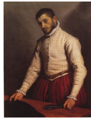
Giovanni Battista Moroni, Le tailleur, 1653

Mais le portrait « au naturel », sans (grand) appareil, revêtait également une signification sociale du fait que la vogue du portrait gagna progressivement un nouveau public, bourgeois, voire plus modeste.