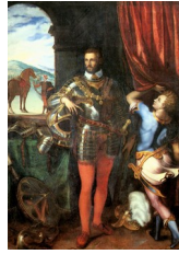
Giulio Campi, Portrait d'Octavio Farnese , 1532

On raconte que, pour réaliser le portrait de Cromwell, le peintre anglais Robert Walker (v. 1605/1610-1656) plaça tout bonnement sa tête sur le corps en armure du portrait de Sir Edmund Verney peint par Van Dyck en 1640 !