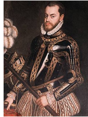
Anonyme, Portrait de Philippe II d'Espagne , 1554

Voici l'exemple d'un portrait inscrit dans la lignée initiée par celui de Charles Quint :