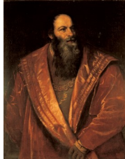
Titien, Portrait de l'Arétin , 1545

L'Arétin 2 dit s'être reconnu dans cette « terrible merveille ».