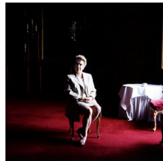
Olivier Roller, Portrait de Catherine Trautman, alors ministre de la Culture, paru dans Libération , 9 août 2000 : variante actuelle, volontairement décalée

Pour en revenir à la Renaissance, le peintre de portrait le plus réputé de son temps fut certainement le Titien (v. 1487/90-1576). Il fut, selon Francastel, le roi du portrait au XVI e siècle, « celui qui en a haussé le prestige au niveau d'un grand art majeur à la mode » (1969 : 120). Titien occupe une place centrale dans la création du portrait d'État.