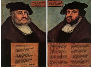
Atelier de Lucas Cranach le vieux, Portraits de deux princes de Saxe, détail du Triptyque des princes, vers 1535 : costume privé, mais épitaphe politique placée sous chaque portrait