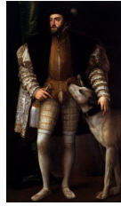
Copie par le Titien, 1532-1533

Voici l'exemple d'un portrait inscrit dans la lignée initiée par celui de Charles Quint :