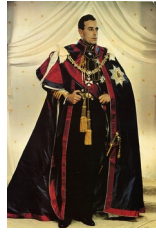
Madame Yvevonde, Portrait photographique de Lord Mountbatten, vice-roi des Indes, années 1930