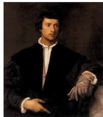
Titien, L'homme au gant , 1520-22