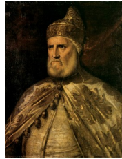
Titien, Le Doge Andrea Gritti , 1537-1540 : en tant que peintre officiel de la République de Venise (à partir de 1516), Titien était tenu de faire le portrait de chaque nouveau doge

Titien se refusera jusqu'au bout à emboîter le pas au mouvement de dépersonnalisation du portrait de cours qui finit par gagner toute l'Italie.