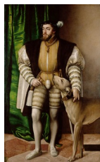
Jakob Seisenegger, Portrait de Charles Quint , 1532

Mais c'est surtout avec leur fils, Charles Quint, que sera constituée cette imagerie officielle. Embelli par ses portraitistes sans pour autant perdre ses traits personnels – en particulier « les yeux enfoncés aux lourdes paupières et la bouche lippue qui caractérisent tant l'empereur Charles Quint que son fils Philippe II et son premier petit-fils Don Carlos » (Laneyrie-Dagen, 1997 : 245) –, Charles Quint est généralement représenté en pied, debout devant une tenture qui deviendra l'un des attributs récurrents dans ce genre de portraits : plus souvent pourpre, elle isole le personnage du reste du monde, à l'image de la Cour vis-à-vis du reste de la société. Autres éléments très fréquents dans les portraits d'apparat : une table couverte d'un tapis de velours et une colonne pour structurer l'espace du tableau (Verhaegen, 1976 : 292) – c'est par ailleurs une référence explicite aux empereurs romains.