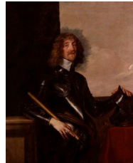
Van Dyck, Portrait de Sir Edmund Verney , 1640

On raconte que, pour réaliser le portrait de Cromwell, le peintre anglais Robert Walker (v. 1605/1610-1656) plaça tout bonnement sa tête sur le corps en armure du portrait de Sir Edmund Verney peint par Van Dyck en 1640 !