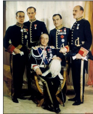
Madame Yvevonde, Portrait de l'ambassadeur d'Espagne à Londres, 1939