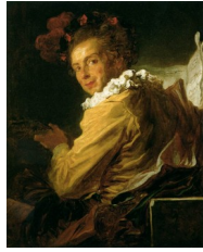
Fragonard, La musique , (Monsieur de la Bretèche), vers 1769

« Ces identifications restent toutefois de l'ordre de la spéculation et, quelle que soit l'identité du modèle, l'exactitude de la ressemblance ne figure guère au rang des préoccupations de Fragonard. » ( Figures de fantaisie du XVI e au XVIII e siècle , 2015 : 268).