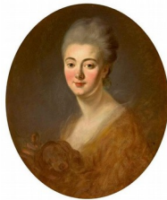
Fragonard, Portrait de Constance de Lowendal , 1775

Voici, à titre de comparaison, l'un des portraits, beaucoup plus classiques et contrôlés, que le même Fragonard peignait pour répondre à des commandes :