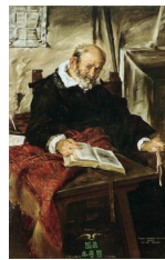
Giovanni Serodine, Portrait de son père , 1622

L'audace formelle se manifestait plus encore dans les portraits d'essence intime :