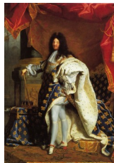
Hyacinthe Rigaud, Portrait de Louis XIV , 1701: dimensions: 2 m 77 sur 1 m 94

Un des monuments du portrait d'apparat a été peint, plus d'un siècle plus tard, en 1701 par Hyacinthe Rigaud, portraitiste officiel de Louis XIV.