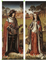
Attribué au Maître de l'Abbaye d'Afflighem (Bruxelles), Portraits du roi Philippe Le Beau et sa femme , 1492-1506

Le genre du portrait d'État apparaît exceptionnellement dans les Flandres à la fin du XV e siècle, par exemple au détour d'un triptyque au dos duquel figurent le roi Philippe Le Beau et sa femme :