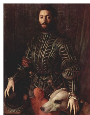
Angelo Bronzino, Portrait de Guidobaldo II de la Rovere, 1532

On retrouve ce type de portrait d'État, en pied et en tenue guerrière dans la peinture italienne :