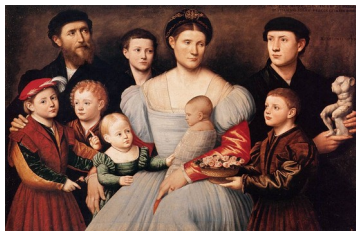
Bernardino Licinio, Portrait de la famille de son frère, 1524

« Licinio a représenté ici son frère avec toute sa famille, prolongeant ainsi leur existence par l'image, et la sienne propre par l'art. »