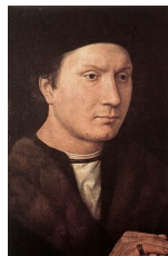
Memling, Portrait d'un homme , vers 1490