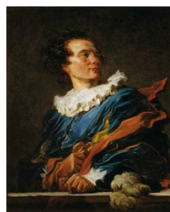
Fragonard, Portrait de l'abbé de Saint-Non , vers 1769

Audace que l'on retrouva un siècle plus tard dans les portraits dits « de fantaisie », brossés par Fragonard en seulement une heure avec la connivence de certains de ses amis :