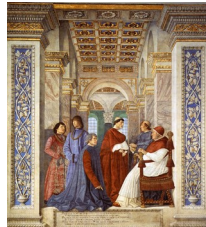
Melozzo da Forlì, Fondation de la Bibliothèque vaticane par Sixte IV , 1475-1477 : le pape est représenté de profil, au cours d'une audience officielle

Voici l'exemple de trois portraits de papes, échelonnés dans le temps, à travers lesquels se manifeste une tendance croissante à la personnalisation :