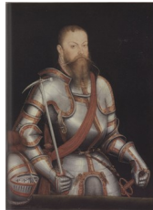
Lucas Cranach le jeune, Portrait de l'Électeur Maurice de Saxe, 1578

En référence, deux portraits de Charles Quint en armure peints par le Titien en 1548 :