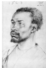
Albrecht Dürer, Tête de Noir , 1508

Des « livres de modèles » circulaient entre les peintres, dans lesquels chacun pouvait puiser des figures pour enrichir ses propres tableaux. Il s'étaient répandus depuis le XII e siècle. Ils regroupaient des « figures humaines ou animales parfaitement codifiées et stylisées (le vieillard barbu, l'ascète émacié, etc.) ». Ils se transmettaient de génération en génération. « C'est dans leur réservoir de types que sont venus puiser tous les artistes jusqu'au XV e siècle. » Tradition remplacée en Italie à la Renaissance par des recueils d'esquisses ou de dessins d'après nature ou d'après l'Antique. De telles feuilles d'esquisses apparurent également dans le Nord. Elles correspondaient à la volonté d'ouvrir les yeux sur le monde sensible, et non plus de transmettre une tradition iconographique (Recht, Schmitt, « Aux origines du portrait moderne », in Recht, Geyer, 1988 : 36 – je souligne).