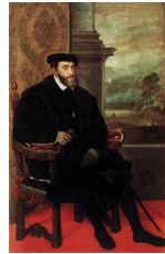
Titien, Charles Quint assis , 1548