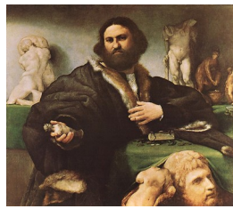
Lorenzo Lotto, Portrait d'Andrea Odoni , 1527

une allusion directe à l'affirmation politique de la ville de Florence par le biais de la statue de David, œuvre d'un sculpteur contemporain, qui figure au fond du tableau.