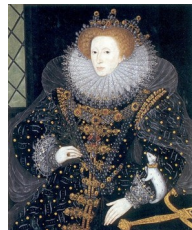
Nicholas Hilliard, Ermine portrait , 1585