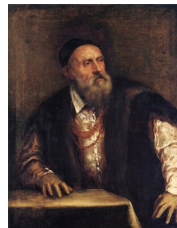
Titien, Autoportrait , 1562-64