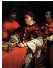
Raphaël, Léon X avec les cardinaux Giulio de Medici et Luigi de Rossi , 1518 : dans le bureau du pape, occupé à lire la bible