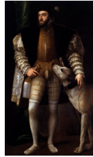
Copie par le Titien, 1532-1533

Voici l'exemple d'un portrait inscrit dans la lignée initiée par celui de Charles Quint :