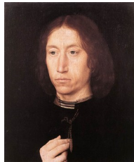
Memling, Portrait d'un homme , 1478-80

Or, dès la Renaissance, les peintres ont exploré une formule de portrait beaucoup plus radicale puisque sans contexte, ou presque. La formule iconographique la plus fréquente consiste à figurer une personne contre un fond uni, indistinct, dans un lieu indéterminé (comme dans le portrait déjà vu peint par Masaccio), voire dans un intérieur restreint qui offre juste un cadre neutre, ou encore devant une fenêtre qui ouvre sur l'extérieur. Le personnage représenté ne fait rien, son habit ne nous renseigne guère sur son état. Il s'agit d'un « pur » portrait au sens où il n'aurait pas d'autre intention que de nous donner à voir le visage et le corps de cet individu-là. Un « pur » portrait pour un « pur » individu.