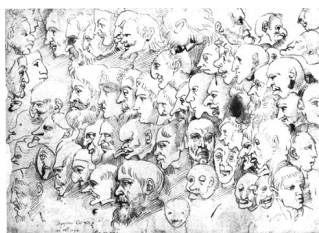
Augustin Carrache, Feuille de caricatures , vers 1594

« Se dit, écrivait un expert de l’époque, d’une manière qu’ont les peintres et les sculpteurs de faire des portraits aussi ressemblants que possible ; mais, par jeu et parfois par raillerie, en aggravant ou en augmentant hors de toute proportion les défauts de la personne représentée, de telle façon que, vus dans leur ensemble, ils paraissent refléter la vérité, alors que dans les détails ils s’en écartent. »