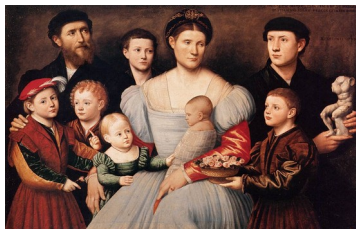
Bernardino Licinio, Portrait de la famille de son frère, 1524

« Licinio a représenté ici son frère avec toute sa famille, prolongeant ainsi leur existence par l'image, et la sienne propre par l'art. »