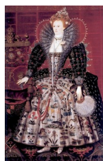
Nicholas Hilliard et son atelier, Hardwick portrait , 1599

« Les peintres multiplièrent à son intention les 'portraits-culte', purs symboles de la Majesté agrémentés d'une formidable prodigalité de détails. Le portrait 'Ditchley' en est le meilleur exemple ». (Gaunt, 1993 : 21)