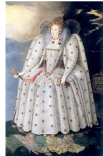
Marcus Gheeraerts le jeune, Ditchley portrait , vers 1593

Dans ce dernier portrait, la reine est montrée debout sur son royaume, dans une « solennité quasi byzantine ».