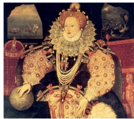
Élisabeth I er devant l'Armada espagnole, par un artiste inconnu, 1588

Autre exemple intéressant, toujours à la cour d'Angleterre : les portraits d'Élisabeth I er . Ici, la force ne saurait être l'attribut mis en avant. Le costume prend alors le relais : lourd, fastueux à l'extrême, il transforme la reine en une sorte d'idole et fait oublier qu'elle est une femme, ce qui n'était pas une qualité pour l'époque. Son corps disparaît littéralement sous le costume royal, qui apparaît comme l'insigne qui fait d'elle une reine et non pas une simple femme.