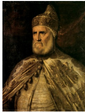
Titien, Le Doge Andrea Gritti , 1537-1540 : en tant que peintre officiel de la République de Venise (à partir de 1516), Titien était tenu de faire le portrait de chaque nouveau doge

Titien se refusera jusqu'au bout à emboîter le pas au mouvement de dépersonnalisation du portrait de cours qui finit par gagner toute l'Italie.