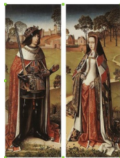
Attribué au Maître de l'Abbaye d'Afflighem (Bruxelles), Portraits du roi Philippe Le Beau et sa femme , 1492-1506

Le genre du portrait d'État apparaît exceptionnellement dans les Flandres à la fin du XV e siècle, par exemple au détour d'un triptyque au dos duquel figurent le roi Philippe Le Beau et sa femme :