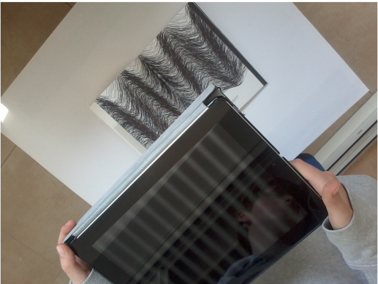
Des fréquences spatiales agies par le corps

craies noires tracées sur le support de la toile. Flora Marchand et Rodolphe Bossé ont imaginé un transcodage sous la forme d'un signal périodique en (256) niveaux de gris continus. Cette transformation permet de structurer un réseau élémentaire de fréquences spatiales modulables. On sait que notre acuité visuelle est déterminée en partie par notre capacité à discriminer l'information d'un stimulus visuel par l'organisation de son réseau de contrastes basses et hautes fréquences (spatiales). Le réseau nous invite à expérimenter le passage continu entre les basses et hautes fréquences bien connu dans le monde du traitement d'images (Transformée de Fourier). Mais ici, nulle commande numérique apparente, pas de potentiomètres associés : l'information traite et module les hautes et basses fréquences au gré des mouvements d'inclinaison des bras. C'est en quelque sorte le processus de la vision qui expérimente et détermine par le corps une échelle de perception haptique du réseau d'information élémentaire.