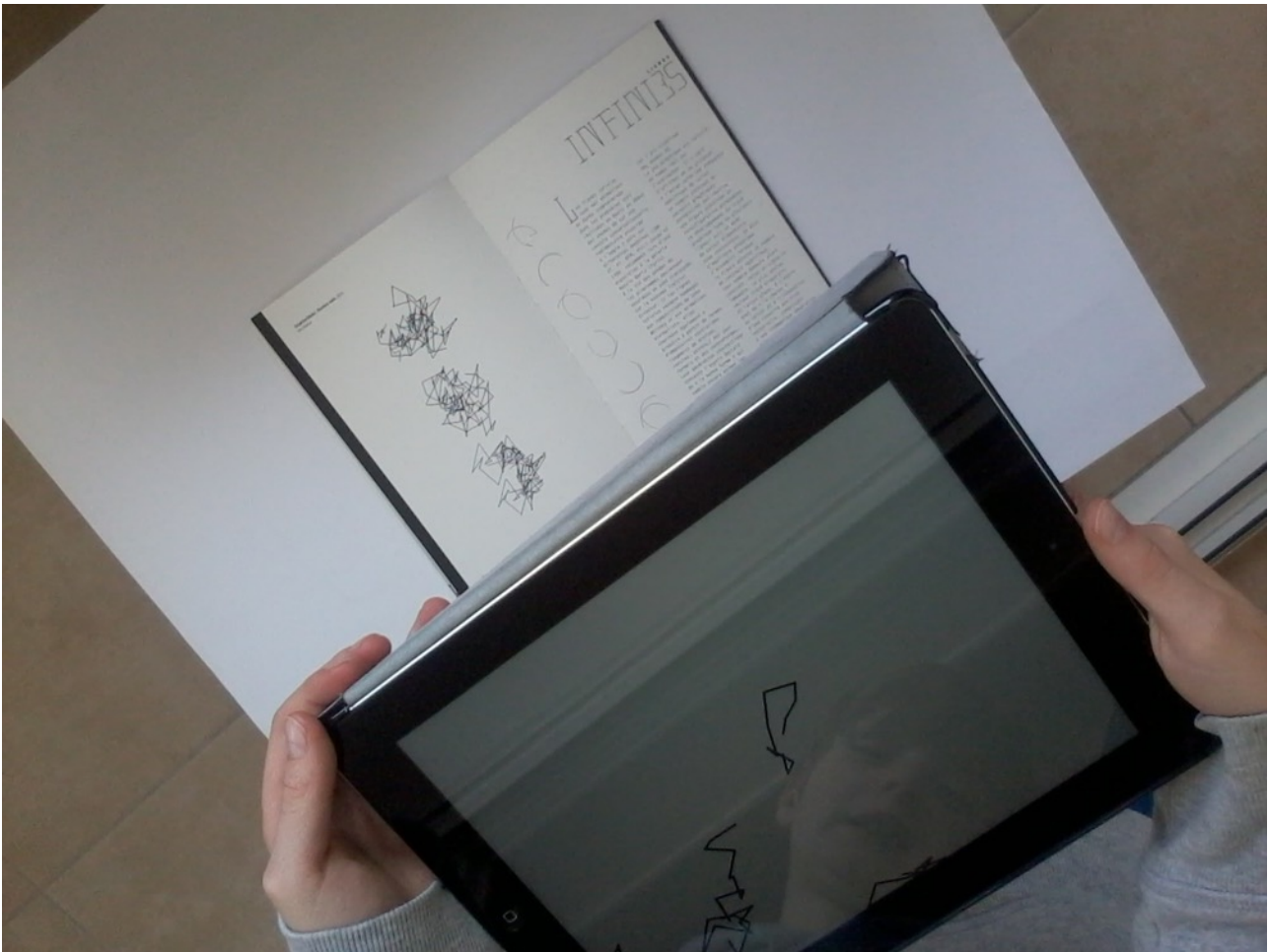
Le mouvement graphique parasité par le traitement de l'information de l'inclinomètre...

Activée par la reproduction de 3 copies d'écrans de l'animation temps réel « 2 marches au hasard dans un cercle », (2008), l'algorithme reprend la marche au hasard graphique (random walk) qui est un peu l'équivalent du « hello world ! » de toute initiation logicielle. 5 tracés aléatoires de 10 segments de droites de taille identique zigzaguent sur la tablettes comme autant d'organismes ou d'êtres graphiques dont il s'agit de maîtriser et anticiper les trajectoires irrésolues... Là encore, cette proposition graphique initiée par Delphine Bezier et intégrée en c++ pour la plateforme Android par Arthur Vimond conditionne une forme d'héroïsme paradoxal. L'algorithme ne comporte aucune virtuosité technique et esthétique. Il s'agit de traiter et de reconfigurer un assemblage de données d'informations mixant des coordonnées graphiques, pondérées par les valeurs de l'inclinomètre qui parasitent le graphisme sempiternellement. Les données semblent glisser et nous échapper comme des anguilles sur la surface de notre tablette. Que devient l'information aujourd'hui, que pouvons-nous en retenir ?