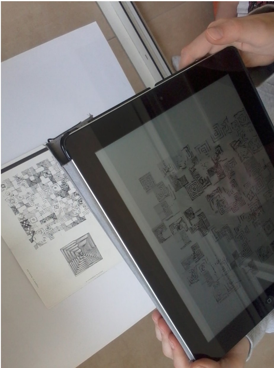
Du graphisme à son ensauvagement

Il doit faire face à une configuration graphique modulaire qui menace ludiquement de s'écrouler comme un château de cartes à chaque mouvement involontaire de la tablette. Il s'agit désormais de maintenir la bonne inclinaison horizontale par une série d'ajustements permanents sous peine de modifier et d'ensauvager l'équilibre graphique initial de l'assemblage des modules. Pour le dire autrement, la reproduction du dessin original s'est remédiatisé en une simulation graphique dont les modules graphiques sont devenus comme les maillons ouverts d'une chaîne. Toute la cohérence, la stabilité et l'organisation orthogonale ne tiennent qu'à un fil : celui de maintenir la tablette à un niveau d'organisation homéostase de l'information. L'utilisateur expérimente à son échelle son incapacité sensorielle à contenir les milliers d'informations qui transitent par la machine. Il a ce sentiment d'avoir reconnu et déjà éprouvé ce moment particulier pour l'image, à la croisée de plusieurs destins.