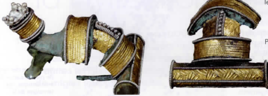
Fibules en bronze, or et argent, typique de la civilisation de Wielbark, II e - III e siècle, provenant de la nécropole de Gronowo. Szczecin, Muzeum Narodowe.

Jordanès, puisqu'il rapporte que ces derniers sont venus de Scandinavie sur trois navires seulement. Comment justifier alors que cet auteur ait attaché tant d'importance à cette migration ? Le rôle politique et militaire joué par les nouveaux venus et la présence parmi eux de leur roi, Berig – père fondateur, peut-être mythique, de la lignée des rois gothiques –, sont sans doute à cet égard déterminants. On peut interpréter l'histoire de l'origine des Goths racontée par Jordanès comme celle de la dynastie gothique royale des Amales, qui régnera jusqu'au VI e siècle, dont Berig, chef des migrants scandinaves, était le premier roi. On peut supposer que le roi des Goths, appartenant à une famille sacralisée, et son entourage immédiat ont, une fois débarqués sur le continent, placé sous