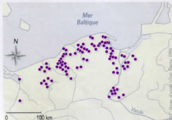
Les sites de la civilisation de Wielbark au I er siècle après J.-C.

“ La culture de Wielbark relève donc de plusieurs peuples, germaniques et non germaniques, et les Goths n'en constituent qu'une tribu. ”