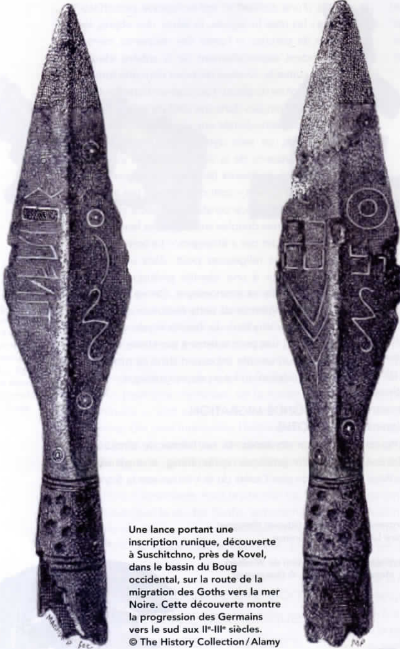
Une lance portant une inscription runique, découverte à Suschitchno, près de Kovel, dans le bassin du Boug occidental, sur la route de la migration des Goths vers la mer Noire. Cette découverte montre la progression des Germains vers le sud aux II e -III e siècles.

“ Le séjour des Goths au nord de la mer Noire et sur le Danube inférieur peut certainement être considéré comme l'époque la plus importante de leur histoire. ”