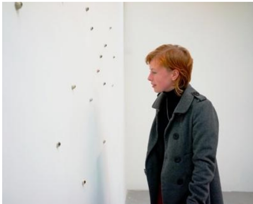
Amélie De Beaufort, Clin d'œil à P , collection de prothèses oculaires, miroir convexe, dimensions variables, 2012-18.

L'empathie détermine aussi cette perméabilité qui autorise le rapport à l'autre 24 , et qui permet au contact de l'art une ouverture non préfigurée vers un spectateur 25 , par la justesse de ce regard qui à la fois touche et se construit. Dans son œuvre Clin d'œil à P , Amélie De Beaufort présente ainsi une constellation de prothèses oculaires (yeux de verre) qui semblent de simples excroissances du mur. L'un de ces yeux, accroché à la hauteur de ceux du spectateur, a été modifié : un miroir convexe remplace l'iris. Dans ce face à face, chacun se voit dans le dispositif qui le regarde d'un regard aveugle le regarder — alors que la plupart du temps le spectateur oublie qu'il est vu lorsqu'il regarde.