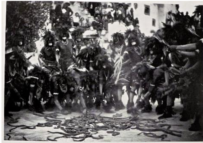
Danse du serpent Hopi, Hartwell & Hamaker, Phoenix, Arizona, vers 1899.

Dans sa dimension anthropologique, le biomorphisme repose sur un double système d'association de signes et d'idées : par ressemblance et contagion.