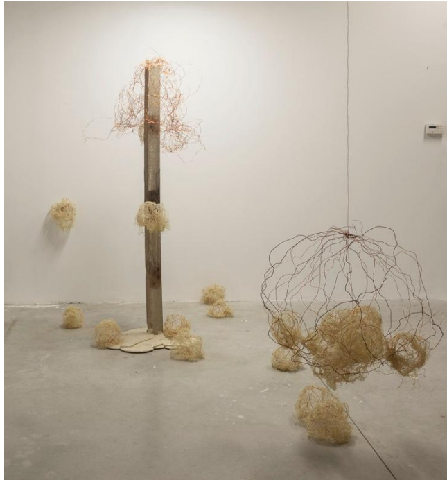
Julie Pelletier, Ma Dame II , 2018, cuivre, colle, sculpture au sol et suspension d'une envergure d'environ 90cm. Sculpture posée au sol hauteur 185 cm, largeur 80 cm.

investissement charnel et une démultiplication des points de vue. Barbara Sarreau évolue dans l'espace des œuvres, et ses gestes répétitifs engagent une forme de méditation sur leur relation.