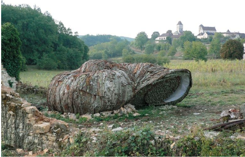
Teruhisa Suzuki, Shelter (abri), chambre de sténopés, installation, Les Arques, 2005.

À travers les trois topiques développées dans les pages précédentes, on a pu percevoir comment les participants aux séminaires ont bénéficié d'un décentrement et d'une « dé-idéalisation » de leur position habituelle concernant le biomorphisme. Les confrontations fructueuses de points de vue n'ont pas forcément abouti à des réalisations transdisciplinaires ; mais elles ont donné une densité au champ d'expérimentation.