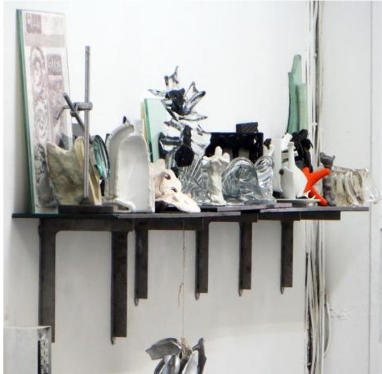
Peter Briggs, Shelf life , 2018, dimensions variables, techniques mixtes, collection de l'artiste.