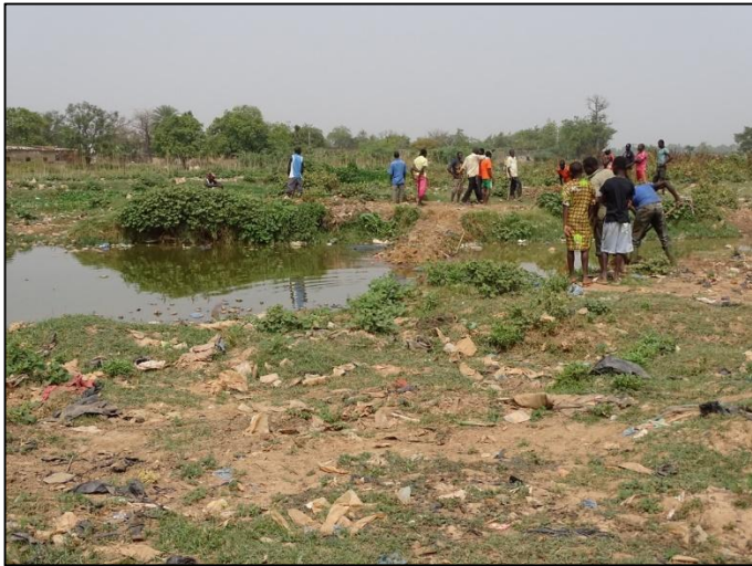
Photo 1 : Entraide lors de la construction d'un barrage visant à stocker l'eau pour irriguer les parcelles