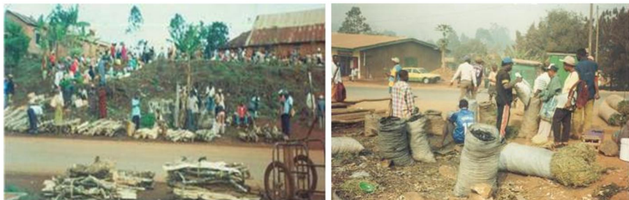
Photo 2 : Commercialisation locale du bois-énergie (à gauche) et du charbon de bois (à droite) dans les hautes terres de l'Ouest-Cameroun