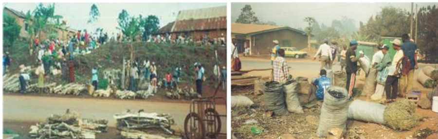
Photo 2 : Commercialisation locale du bois-énergie (à gauche) et du charbon de bois (à droite) dans les hautes terres de l'Ouest-Cameroun