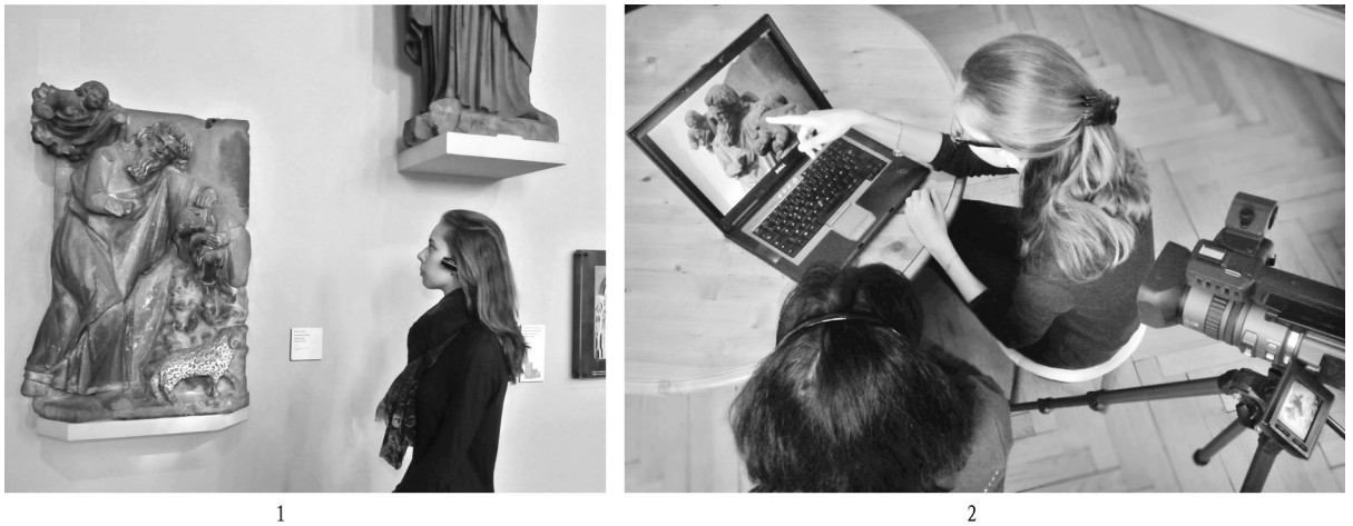
图2// 视频记录观众行为痕迹,并在观众参观结束后立即投屏

1.观众佩戴着迷你摄像头 2.观众在观看第一人称视角拍摄的视频,详细并准确地回忆和解释她做了什么