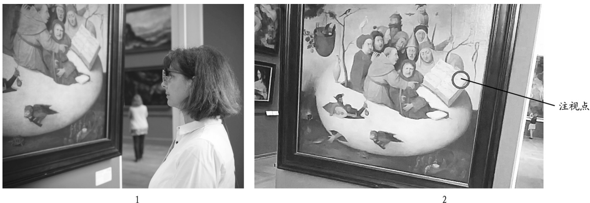
图一// 基于眼动追踪法的观众体验