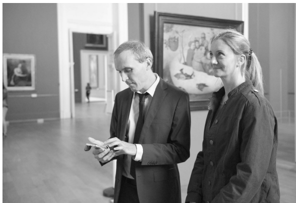
图三// 观众在法国里尔美术馆(The Palais de Beaux-Arts in Lille)配备情绪地图设备