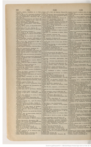
Figure 4: Nouveau Larousse illustré ; Figure 6: Annuaire-almanach du com-dictionnaire universel encyclopédique, merce, de l'industrie, de la magistrature et de l'administration , 1871, p. 200