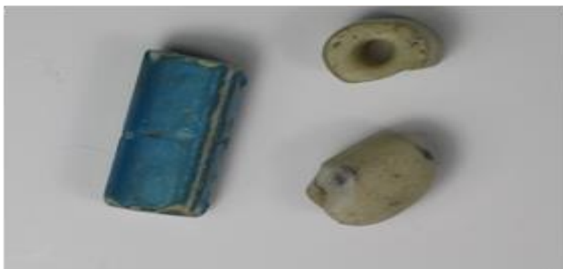
Figura 1: Cuentas tubulares y discoidales precolombinas.

Ya para el siglo XVI, durante el proceso de consolidación de la conquista del Valle Central de Costa Rica, Juan Vázquez de Coronado en su primera carta de relación sobre la conquista de este territorio, en 1562, hace referencia a las chaquiras como objeto utilizado por los españoles para el rescate por productos indígenas. 452 Las chaquiras a que se refiere Vázquez de Coronado, son cuentas traídas por los españoles a América y usadas para el intercambio con los indígenas, por lo que es importante tener en cuenta la diferencia entre chaquira autóctona y chaquira colonial introducida por los colonos españoles y valorada por los indígenas, la cual se refiere en realidad a cuentas de abalorio (Figura 2).