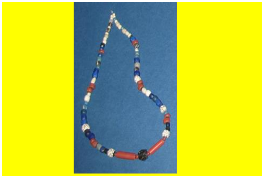
Figura 2: Cuentas tubulares y discoidales de cerámica españolas (chaquiras). Colección: Museo Nacional de Costa Rica.

que el aprecio de que gozaron las chaquiras durante el período precolombino por parte de las sociedades autóctonas, se mantuvo durante el período colonial, utilizándose como un medio importante para las transacciones de distintos bienes entre los conquistadores y colonizadores y los indígenas.