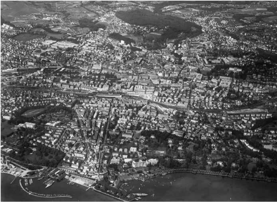
Fig. 2: L'urbanisation croissante des rives du Léman amène à l'étude des premières stations d'épuration des eaux dans les années d'après-guerre. La Ville de Lausanne lance des travaux préliminaires en 1948 mais n'inaugurera la station de Vidy qu'en 1968.