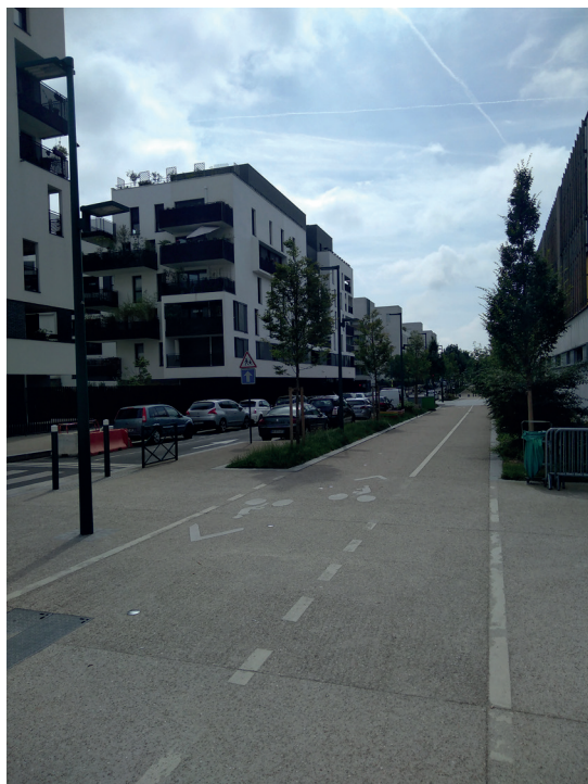
Photo 1 Avenue Chenard et Walker à Chandon-République avec une piste cyclable aménagée sur le trottoir

Au-delà des constructions neuves, l'écoquartier de Bel Air-Grands Pêchers 14 , projet très distinct des deux autres, a également eu des répercussions positives pour un certain nombre d'habitants, grâce aux réhabilitations des logements et des façades des immeubles. Ne se cachant pas de sa démarche de marketing territorial, le PRUS a relativement restructuré l'image du quartier aux yeux de plusieurs habitants.