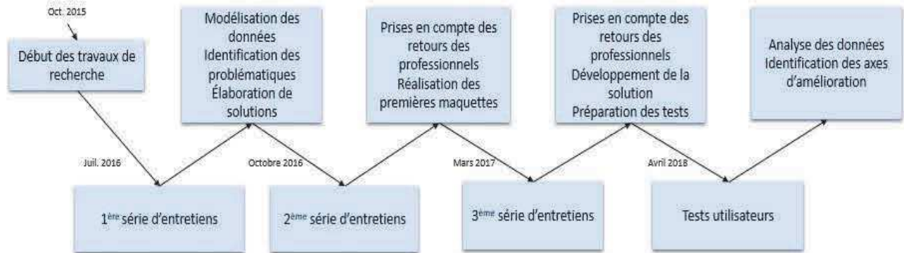
Figure 1 : illustration des différentes phases itératives mises en place

pour valider nos propositions sous forme de maquettes. Enfin, une fois celles-ci validées, nous avons développé une version bêta de notre plateforme sous forme de site web et nous avons effectué des tests utilisateurs avec les professionnels. La figure Figure 1 illustre l'enchaînement des différentes phases de notre étude :