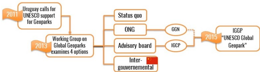
Figure I.3. Schéma des étapes finales de négociation pour tendre vers la création du label UGG (source : Du et Girault 2018, p. 12)

En novembre 2015, lors de la 38 e session de la conférence générale de l’UNESCO, le programme international pour les géosciences et les géoparcs (PIGG) a approuvé la création d’un nouveau label UNESCO Global Geopark (UGG) (UNESCO, 38 C/14, 2015) (figure I.3).