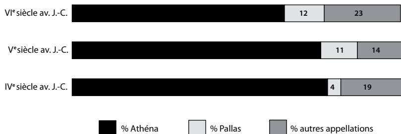
Fig. 2 – Répartition des désignations d'Athéna dans les dédicaces acropolitaines (VI e s.-IV e s. av. J.-C.)

Sur les 355 inscriptions votives dédiées à Athéna, une grande majorité de ces dédicaces est concentrée sur deux siècles seulement – les VI e et V e siècles av. J.-C. 30 . Sans surprise, les attestations de « Pallas » sont également regroupées autour de ces deux siècles : 58 % pour le V e siècle, 26 % pour le VI e , sur un total de 33 occurrences. Si nous comparons les différentes pratiques onomastiques, nous obtenons les résultats suivants :