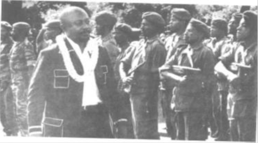
Photo 2. Ali Soilih qui passe devant son armée révolutionnaire.

Pour mieux endoctriner cette armée avec l'idéologie socialiste, composée en majorité de jeunes paysans venant des milieux défavorisés, il place la jeunesse au premier rang de ses idées nationalistes avec un discours très solide. Il tente de démontrer aux jeunes Comoriens que leur présence est indispensable pour la construction du pays car sans eux l'avenir du pays risque de s'assombrir. Les jeunes commencent à croire en lui, à dire qu'il est le seul capable de sauver les Comores postcoloniales. L'enivrement de ces jeunes soldats dépasse les espérances du nouveau maître.