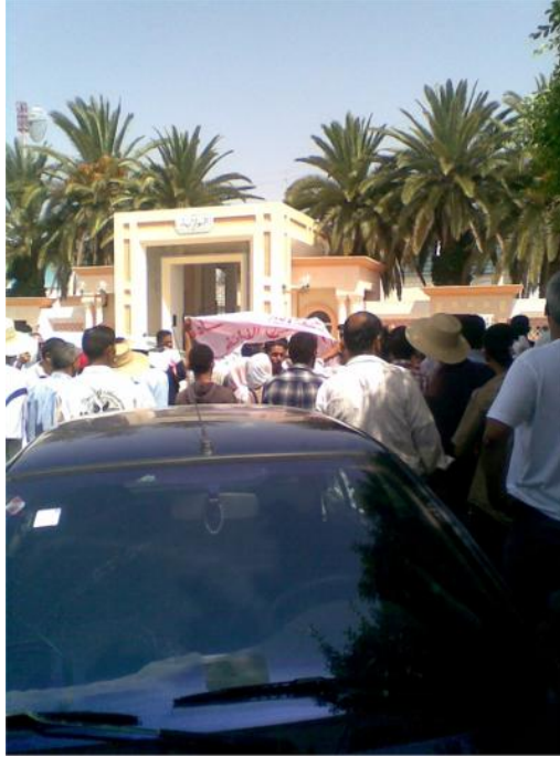
Le web-magazine Les Observateurs de France 24, du 16 juillet 2010, rend compte de la manifestation des fellahs et de leurs soutiens du 15 juillet 2010, à Sidi Bouzid. (Capture d'écran, site France 24, Les Observateurs, 16 juillet 2010).

Puis, le 15 juillet, après la manifestation de plus d'une centaine de personnes – peut-être 200 – devant le gouvernorat de Sidi Bouzid, il joignit à Paris, Sarra Grira, une web-journaliste de l'équipe du magazine du journalisme d'en bas de France 24, Les Observateurs, qui reprirent les images et son témoignage, ce qui fut remarqué à Sidi Bouzid 107 .