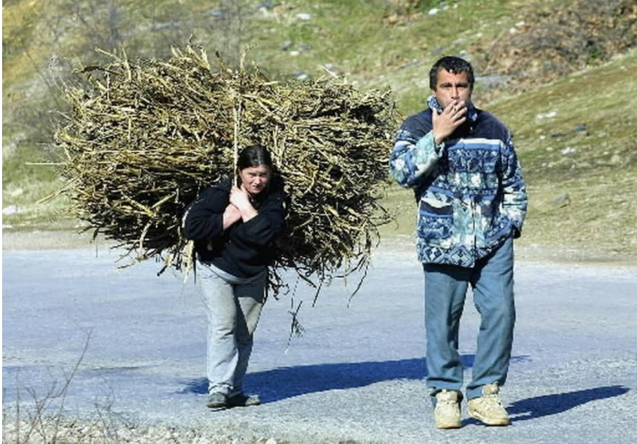
Fig. 3. Kohajone.com, 7 août 2018.

endossèrent à leur tour la responsabilité de la fin du rêve de la « révolution démocratique » en Albanie.