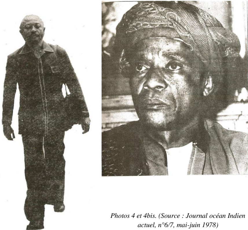
Photos 4 et 4bis.

Je suis un bourgeois et je suis riche. Lequel d'entre vous n'aimerait pas être riche et bourgeois... (Journal océan Indien actuel, n°19/20, juin-juillet 1979)