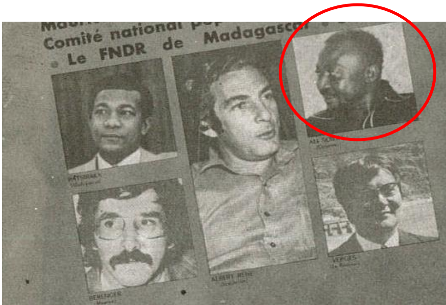
Photo 1. Les membres du parti et organisation progressiste des îles du Sud-ouest de l'océan Indien conviés à la conférence du 27 au 29 avril 1978 à Victoria (Seychelles) : Le SPUP des Seychelles, le MMM de Maurice, le PCR de La Réunion, le FNDR de Madagascar et le Comité national populaire des Comores représenté par Ali Soilihi (en cercle rouge). Cette conférence consiste à mettre en place une politique anti-impérialiste, la solidarité avec les peuples en lutte d'Afrique australe, la lutte pour un nouvel ordre économique et l'exploitation équitable des ressources des océans dans le partage des îles.

Laboratoire Observatoire des Sociétés de l'Océan Indien (OSOI)