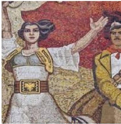
Fig. 1. Ce n'est pas une coïncidence si une femme apparaît comme la figure la plus en vue. Mosaique murale, Muzeu Historik Kombëtar , Place Skandemberg, TËrana, 1981.

L'émancipation féminine constitue le point focal autour duquel semblent se dénouer (ou s'emmêler) de manière éclatante la « révolution communiste », telle que la concevait Enver Hoxha, et la « révolution démocratique », héritée de la politique « gorbatchévienne » de Ramiz Alia. C'est à travers ce thème que l'on peut lire les contradictions les plus vastes (et les plus paradigmatiques) liées à ces deux révolutions.