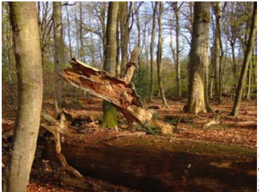
Frédéric Gosselin, Irstea

Le projet GNB s'est appuyé sur le PSDRF (à quelques ajustements près) pour relever les caractéristiques de peuplements forestiers sur l'ensemble des placettes. En plaine, la jauge d'angle retenue pour relever les arbres vivants a été portée à 2 % (au lieu des 3 % utilisés habituellement), pour avoir une meilleure représentativité des très gros arbres en augmentant la surface d'échantillonnage. La distance maximale a cependant été limitée à 40 m pour des raisons pratiques. En montagne, la jauge d'angle et le diamètre de précomptage n'ont pas été modifiés, également pour des raisons pratiques.