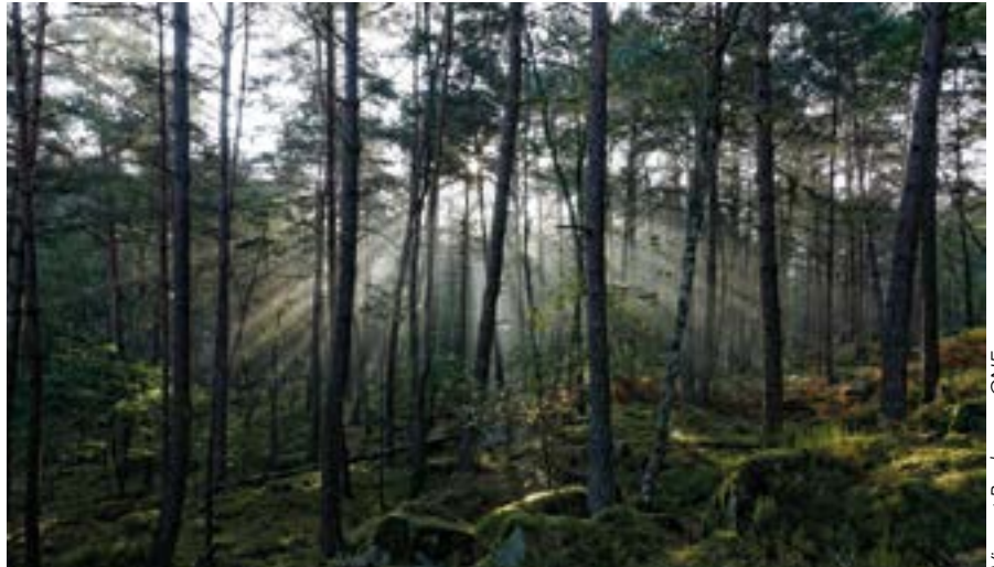
Vincent Boulanger, ONF

Les deux derniers modèles de cette catégorie font l'hypothèse que l'arrêt de l'exploitation en tant que tel n'a pas seulement un impact local, mais