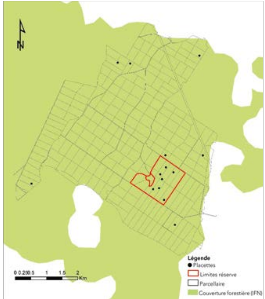
Fig. 1 : exemple du plan d'échantillonnage du massif du Haut-Tuilleau (Aube)