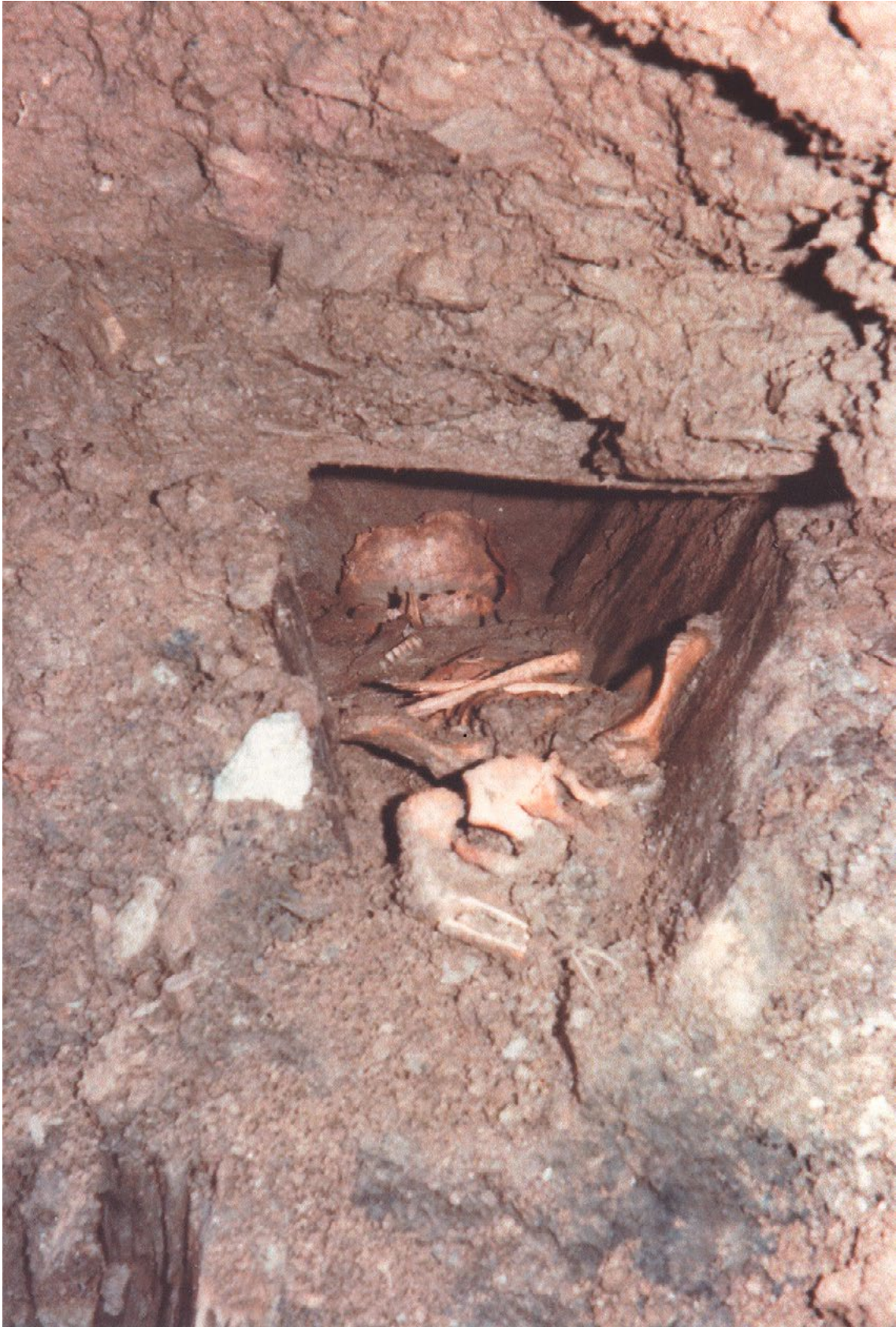
Figure 2. Vue de détail de la sépulture I recoupée par les travaux fin mars 1982.