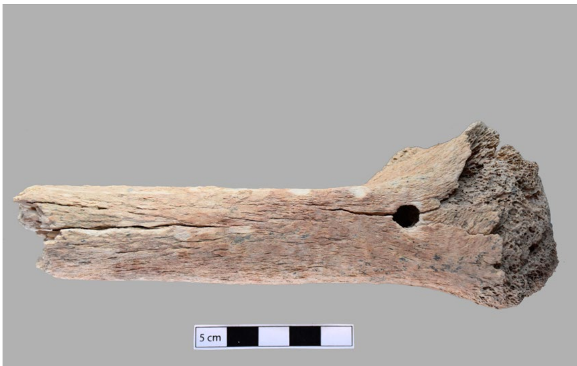
Figure 4. Tiers proximal de diaphyse de fémur gauche conservé et daté par radiocarbone (vue de la face antérieure).