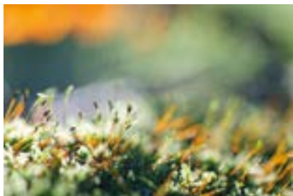
Vincent Boulanger, ONF

La comparaison de forêts exploitées et non exploitées a fait l'objet de nombreuses publications scientifiques dans le monde, avec des résultats hétérogènes. Un travail de synthèse (méta-analyse) a été conduit en 2010 sur 49 études réalisées en Europe pour quantifier l'impact sur la richesse spécifique de l'arrêt de la gestion forestière (Paillet et Bergès 2010). La méta-analyse est un outil statistique qui permet de traiter un ensemble d'études portant sur le même thème pour dégager des tendances générales.