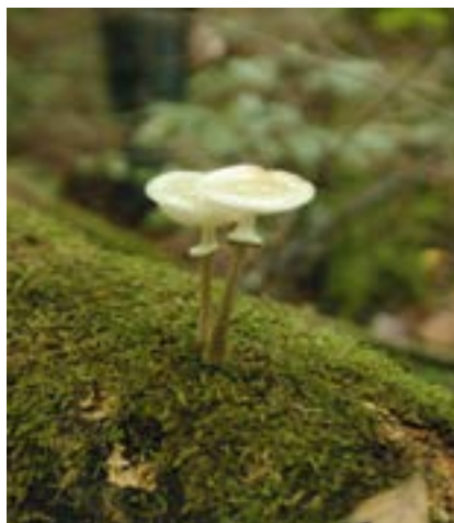
Patrice Hirbec, ONF

Les relevés dendrométriques du projet GNB ont révélé des différences manifestes entre forêts exploitées et réserves pour la structure, la composition des peuplements, et la densité de microhabitats, suggérant une dynamique forestière assez rapide suite à l'arrêt de l'exploitation (article 3). La réponse de la biodiversité à cette dynamique forestière en termes de variations de la richesse spécifique est mitigée, puisque la mise en réserve et/ou la durée depuis la dernière exploitation entraînent une réponse forte pour deux des sept taxons (chauves-souris et champignons lignicoles) et pour deux des six sous-groupes (bryophytes forestières ou champignons lignicoles menacés).