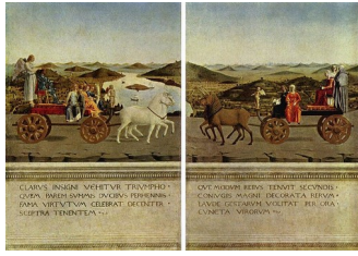
Piero della Francesca, Dyptique du Triomphe de la chasteté , 1465-1472