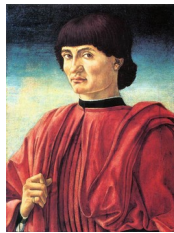
Andrea del Castagno, Portrait d'un homme , milieu du XV e siècle

En Italie, le premier portrait de face aurait été peint par Andrea del Castagno (1423-1457), au milieu du XV e siècle :