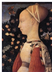
Pisanello, Portrait d'une jeune fille de la maison d'Este, vers 1433

Quelques exemples de portraits de profil :