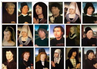
Hans Memling, Aperçu de la trentaine de portraits qu'il a peints

Dans le dernier tiers du XV e siècle, Hans Memling était devenu le portraitiste le plus en vue de Bruges. Il avait de nombreux clients parmi les marchands et banquiers de la ville, souvent étrangers, italiens, espagnols ou allemands.