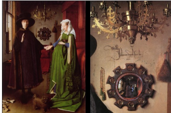
Jan van Eyck, Portrait des époux Arnolfini , 1434

En Hollande, la peinture de portraits de face sur chevalet fut plus précoce et dans un style très différent.