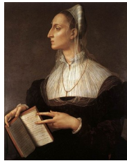
Angelo Bronzino, Portrait de Laura Battiferri, vers 1555-1560

Exemple plus tardif qui montre la survivance de cette tradition :