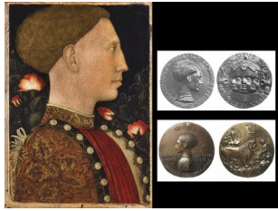
Portrait de Lionel d'Este, 1441, avec plusieurs versions gravées en médaille par Pisanello

Variante du portrait de Sigismond Pandolfo Malatesta par Piero della Francesca, 1450-1451 : contemporain d'une fresque réalisée à Rimini, sur laquelle le prince apparaît agenouillé devant son saint patron, saint Sigismond, ce portrait, comme l'effigie de la fresque, s'inspire d'une médaille commémorative réalisée l'année précédente.