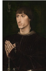
Rogier Van der Weiden, Portrait de Philippe de Croy , vers 1460

Attention toutefois aux erreurs d'appréciation anachroniques : certains tableaux qui nous apparaissent aujourd'hui comme des portraits indépendants sont en réalité ce qu'on appelait des « portraits dévotionnels », dont Van der Weiden fut l'inventeur ; ils étaient combinés avec une représentation de la Vierge à l'Enfant.