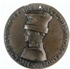
Pisanello, Médaille de Niccolò Piccinino (condottiere, 1386-1444), 1439-1440

Pisanello (1395-1455) utilisa beaucoup le profil dans les très nombreuses médailles qu'il réalisa, selon une reprise de la numismatique antique caractérisée par le réalisme des effigies. Initiateur de cette nouvelle mode, Pisanello fut très sollicité de son vivant par de nombreux princes désireux de posséder leur propre médaille.