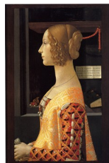
Portrait de Giovanna degli Albizzi Tornabuoni, 1488

Un exemple intéressant est celui de l'un des rares portraits sur toile peints par Ghirlandaio :