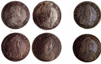
Portraits successifs de Louis XIV sur les pièces émises sous son règne