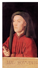
Jan van Eyck, Léal souvenir ou encore Thymothéos , d'après l'inscription secondaire portée sur la pierre, 1432

Fonction également repérable dans la peinture flamande, plus précoce à développer le portrait. Certains de ses premiers exemples affirment clairement leur fonction de souvenir d'une personne (disparue ou encore vivante ?), comme le fameux portrait peint par Jan van Eyck, sous-titré Léal souvenir (1432) :