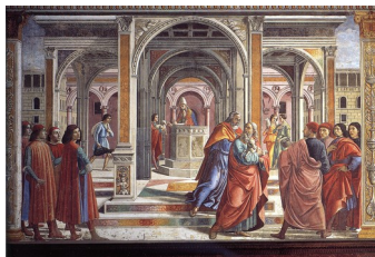
Ghirlandaio, Joachim expulsé du Temple , vers 1485-1490

C'est également par le recours à l'effigie de face que se distinguaient, au sein d'une même fresque, certains personnages prééminents et d'autres qui, par cette posture, affirmaient leur prétention à s'extraire du lot.