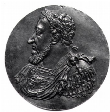
Benvenuto Cellini, Portrait de François 1°, 1537 2

En Italie, le premier portrait de face aurait été peint par Andrea del Castagno (1423-1457), au milieu du XV e siècle :