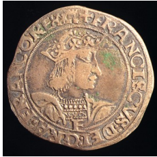
Teston émis sous François 1°, 1541