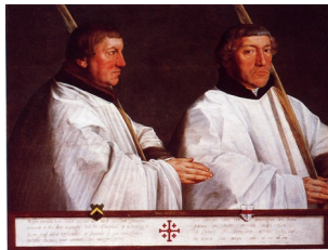
Anthonis Mor, Portrait de deux chanoines, 1544

Autre exemple de transition en portrait de profil et de face :