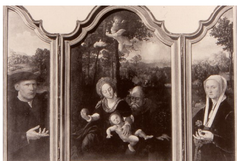
Dirck Jacobsz, Volets avec donateurs, 1530

La convention du profil – établie et largement reprise dans la peinture religieuse où elle permettait de situer sur des plans différents l’image sacrée et les donateurs terrestres – fut battue en brèche au sein même de cette peinture rituelle, que ce soit sur les retables flamands lorsque les donateurs commencèrent à se faire représenter de face et non plus dans l’adoration de la figure mystique centrale :