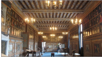
Galerie des Illustres, Château de Beauregard, première moitié du XVII e siècle

Dernier indice de l'importance acquise par le portrait : la création de galeries au cours du XVI e siècle et au-delà.