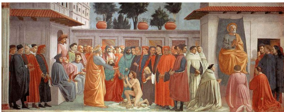
Masaccio, Saint Pierre en chaire , 1427-1428

Autre exemple, plus ancien, d’une même posture de face valant signature de la part du peintre :