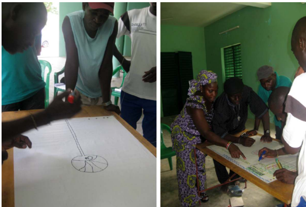
Figure 3 : Construction de la carte du terroir rizicole de Diembéring, Sénégal

(Cormier Salem & Sané, ce volume). Dessinée sur une feuille de papier, la route constitue souvent le premier élément tracé. Elle est suivie des autres points de repères de la communauté, souvent des repères naturels, comme le montre la figure 3 où les villageois ont dessiné le fromager géant qui est l'emblème du village de Diembéring, puis les quartiers ont été délimités avec une géométrie approximative. Les infrastructures scolaires et sanitaires ainsi que les unités paysagères (dunes, mangrove, rizières) viennent compléter la carte. La toponymie est utilisée pour nommer les quartiers, indiquer les directions (canal, piste) et les zones de passage.