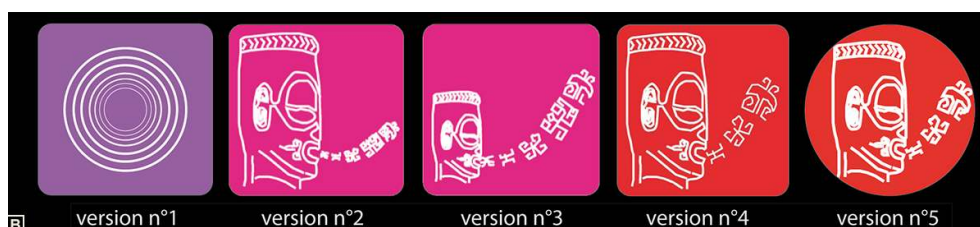
Figure 2b : Les traditions orales et spectacles – essai de symbologie