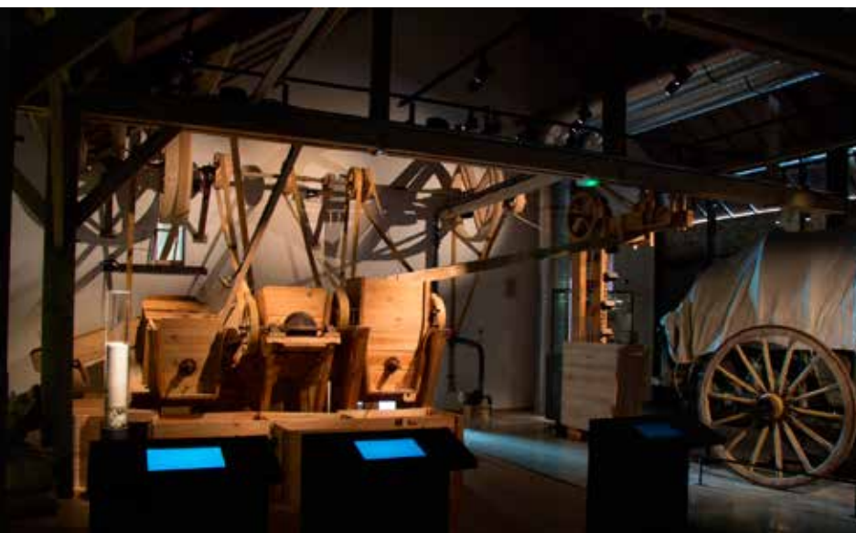
La machine à laver le sel au sein du Musée, 2013.

ce que l'on appelle aujourd'hui les humanités numériques. L'originalité de la modélisation 3D, qui n'est pas a priori une méthodologie de sciences humaines, réside pour l'histoire et le patrimoine dans la mise en perspective de la relation complexe entre passé et présent, entre culture matérielle et culture immatérielle, au-delà de l'approche textuelle traditionnellement utilisée en histoire et de l'utilisation de l'iconographie documentaire. Cette transposition des connaissances vise clairement à une contribution innovante pour les enjeux sociaux dans le futur.