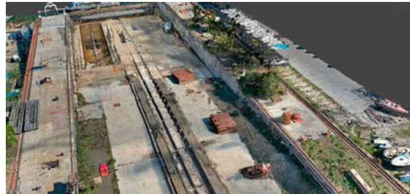
Nuage de points de la cale des chantiers de La Ciotat, 2020.