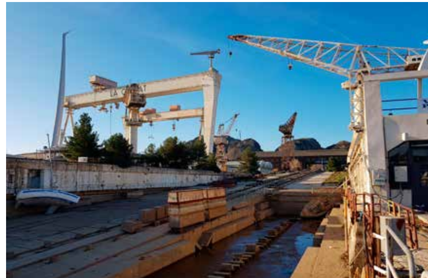
La cale des chantiers de La Ciotat, 2020.