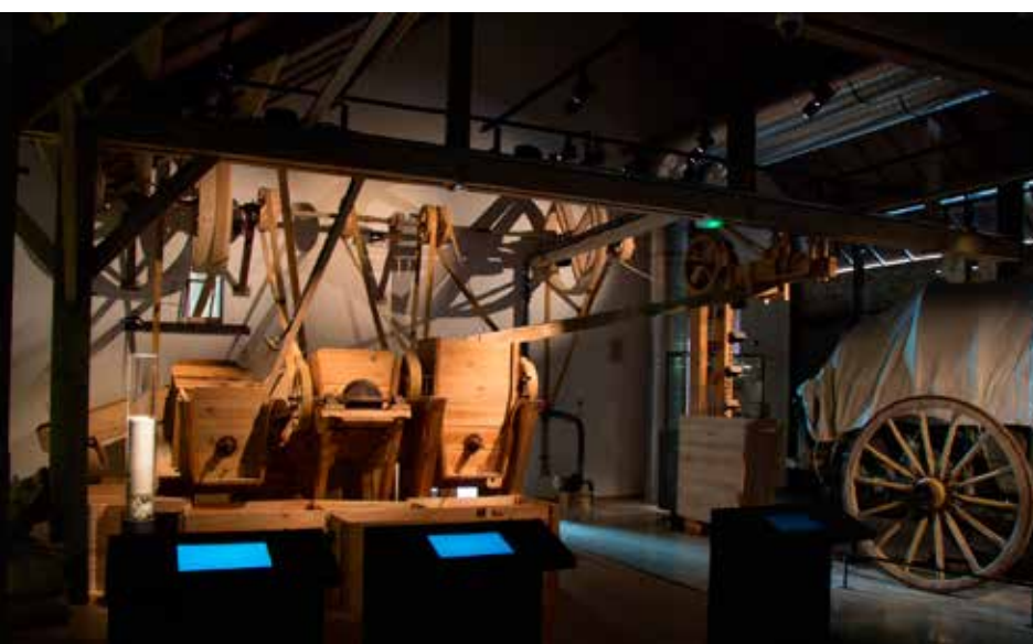
La machine à laver le sel au sein du Musée, 2013.

à l'architecture, à l'étude formelle, comme aux techniques et aux réseaux. Les objets et les échelles sont multiples : usines, ateliers, lieux de production mais aussi, de manière plus large, compréhension et explication des flux, du trafic, des circulations, jusqu'au « territoire » et à l'histoire des « paysages ».