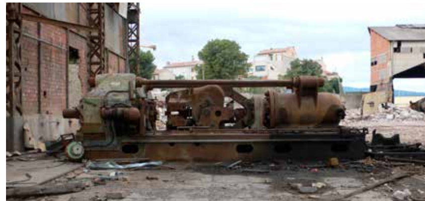
La cintreuse à membrures, 2008.