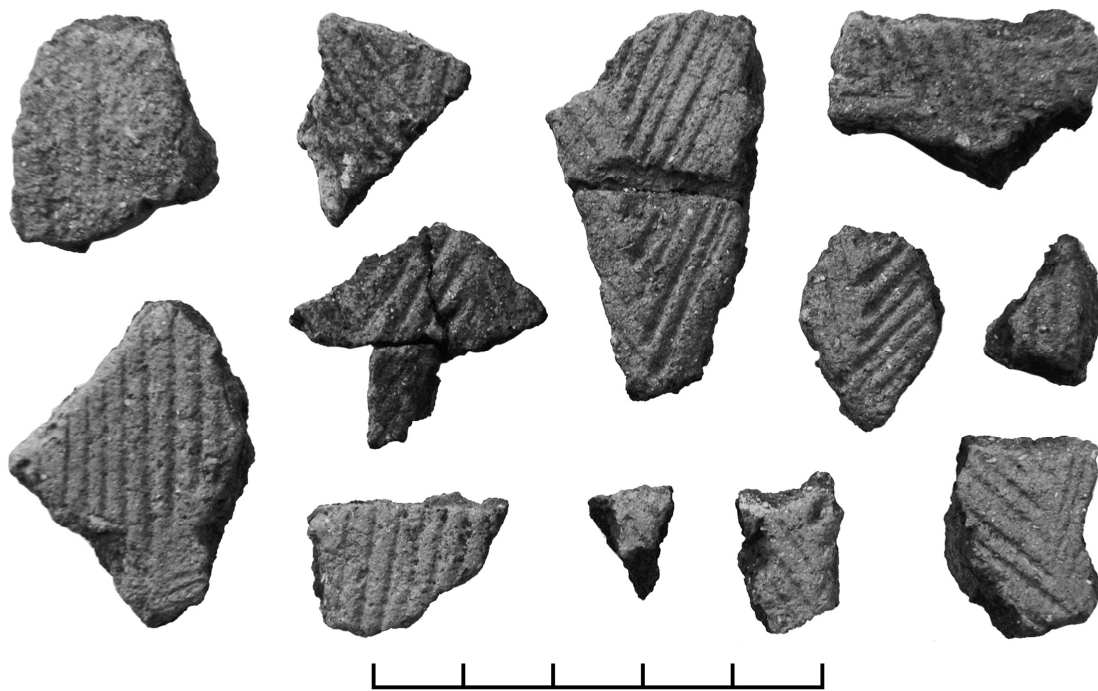
Рис. 2. Фрагменты керамики афанасьевской культуры, найденные недалеко от Хуроогийн узуур

каменных стел Минусинской котловины. Для них характерен вертикальный ряд поперечных линий на узкой грани (рис. 3, 4). Есть основания связывать эти стелы с традицией афанасьевской культуры (Есин 2010б: 65; 2010в: 83–85). Содержательно близкие рисунки присутствуют также в наскальном искусстве окуневской культуры (рис. 3, 6–8). Они сохраняют в основе тот же образ деревянного столба или шеста, оформленного в виде человеческой фигуры при помощи развешенных одеяний и оружия. Стилистически они различны, однако трудно допустить, чтобы эти изображения эпохи ранней бронзы из Минусинской котловины и рисунки Хуроогийн узуур разделял очень большой временной период. Рассмотренные аналогии из Минусинской котловины позволяют определить время существования столпообразных изображений Хуроогийн узуур эпохой энеолита–ранней бронзы. Они же дают достаточно весомые аргументы в пользу вероятной связи данных образов с афанасьевской культурой.