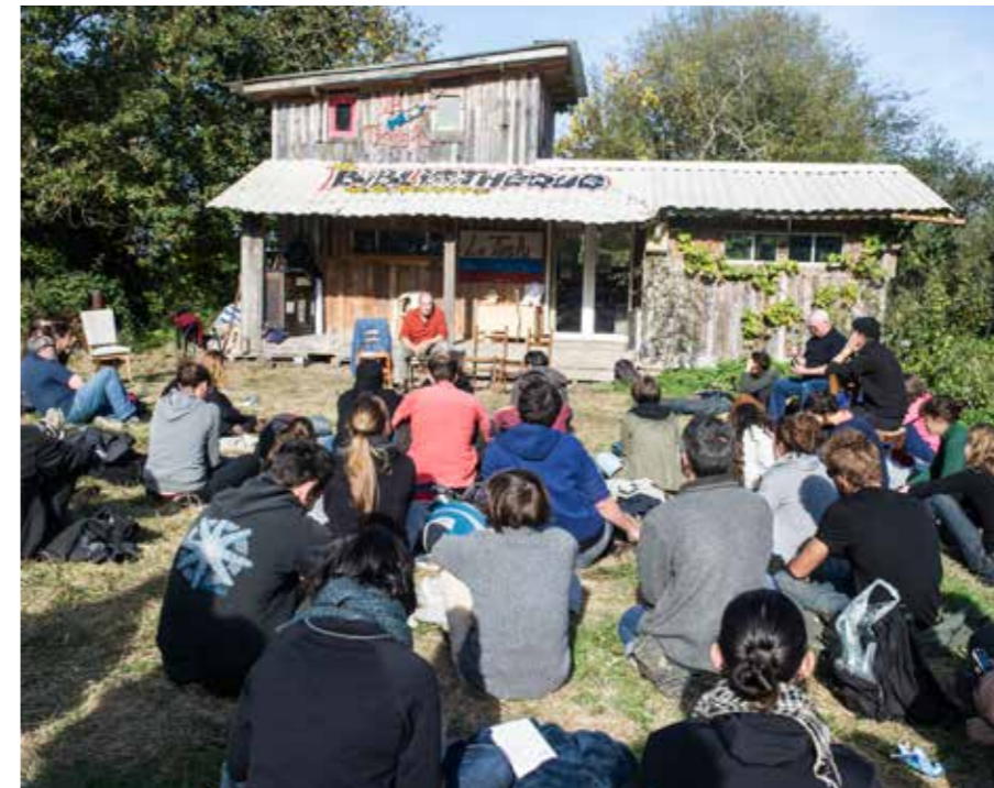
Rencontre avec l'auteur Alain Damasio à la bibliothèque du Taslu, octobre 2016, ZAD NDDL.

pourrait ne sembler qu'un croisement lambda entre deux routes de campagne, mais ça existe comme lieu parce que c'est à la fois raconté et sillonné. C'est aussi parce que le territoire recèle tous ces moments vécus, cette histoire commune accumulée, qu'il est aujourd'hui autant défendu.