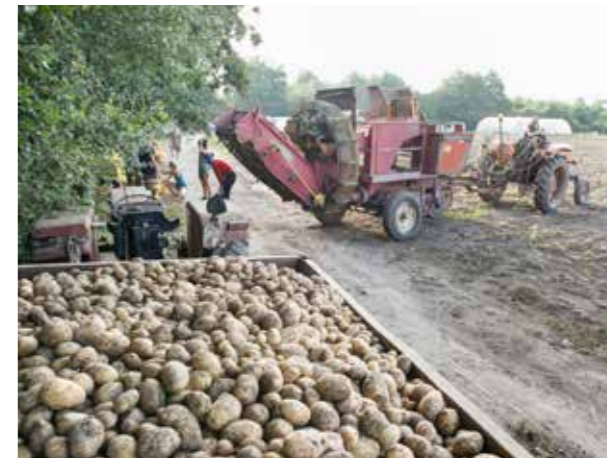
Chantier patates, août 2017, ZAD NDDL.

forêts, puis comment les communes ont peu à peu revendu les communs... Le bocage a été une façon de délimiter des parcelles de propriété privée. À l'époque, ça a d'ailleurs mené à des révoltes assez importantes, notamment dans le coin ; à Treillières, des villageois avaient détruit des haies et des talus. Il y a donc une sorte de paradoxe... Mais, pour la plupart des occupants, le bocage n'est pas un paysage idéal à protéger, mais plutôt un paysage en devenir résultant d'une histoire complexe et devant être réapproprié.