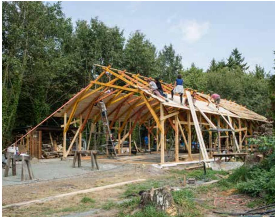
Chantier de construction de l'Ambazada, futur QG intergalactique de luttes, août 2017, ZAD NDDL.

diverses activités. Usages, ça veut aussi dire que ça ne concerne pas que les habitants, mais tous les gens qui pratiquent la zone, les promeneurs, les chasseurs, les motards, les gens qui viennent à la bibliothèque, les groupes qui viennent s'organiser ici, etc. La réflexion bat son plein en ce moment, et c'est hyper-intéressant de réfléchir comment on définit ce que sont ces usages, s'il y a des limites, quelles sont-elles, et, du coup, qui est concerné.