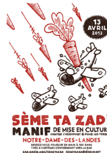
Affiche Sème ta ZAD - version avions et carottes, “Le 13 avril grande manif de mise en culture des terres de la ZAD !”, avril 2013.

On manque parfois de fonds à Sème ta ZAD... On aimerait tendre vers une autonomie financière, mais on a du mal à la rendre durable, une caisse collective, c'est complexe à gérer. En même temps, c'est normal ! Le sujet de l'argent n'est pas simple, c'est beau de porter un truc qui n'a pas pour objectif d'être rentable mais il faut bien alimenter la caisse d'une manière ou d'une autre, rien que pour pouvoir continuer à porter les projets agricoles, et parce que l'idéal qu'on défend derrière, c'est quand même l'autonomie alimentaire."