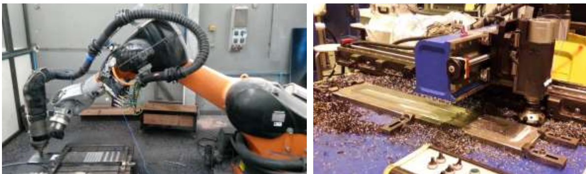
Figure 1. Machines mobiles des essais : robot d'usinage et fraiseuse portative.