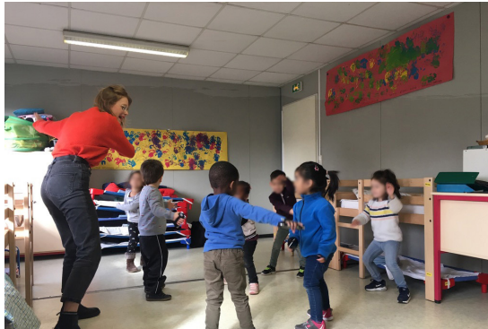
Figure 1 : Scénario des Histoires interactives . Ici les enfants équipés de smartphone réalisent les gestes correspondant à l'histoire de "La chasse à l'ours".