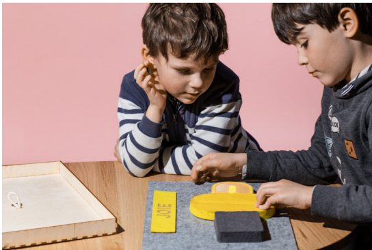
Figure 1 : Scénario des Matières à apprendre . Ici les enfants ont assemblé le circuit jaune et associent le geste "rouler" à l'émotion de la joie.