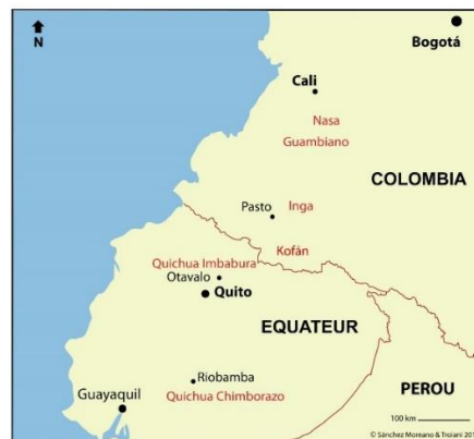
Mapa 1. Lugares de origen de los grupos indígenas de la ciudad de Cali

En Cali, la tercera ciudad más poblada de Colombia (aprox. 1.800.000 habitantes, según el censo de 2018 3 ) y principal polo económico del suroccidente del país, conoce fenómenos de movilidad interna marcados por la presencia de poblaciones indígenas, afrocolombianas y rurales. Según el DANE, en el 2005, el 0,5 % de la población de Cali se reconoce como indígena. Concretamente, en la ciudad hay seis grupos indígenas sociopolíticamente organizados: los nasa, los quichua, los inga, los yanacóna, los kofán y los misak 4 . La mayor parte viene de departamentos vecinos como Chocó, Nariño, Cauca, Putumayo y Huila, pero también de las provincias de Imbabura y Chimborazo en Ecuador (Mapa 1), por lo que la movilidad a Cali también es transnacional.