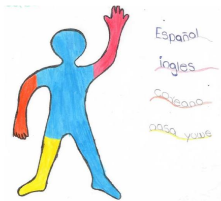
Ilustración 4. El retrato lingüístico de Sabri.

Finalmente, y de manera sorprendente, aparecen en la descripción de repertorios lingüísticos, lenguas “distantes” que tradicionalmente no hacen parte del paisaje lingüístico de la ciudad de Cali. Sabri, por ejemplo, pintó en su silueta el coreano.