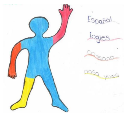
Ilustración 4. El retrato lingüístico de Sabri.

Finalmente, y de manera sorprendente, aparecen en la descripción de repertorios lingüísticos, lenguas “distantes” que tradicionalmente no hacen parte del paisaje lingüístico de la ciudad de Cali. Sabri, por ejemplo, pintó en su silueta el coreano.