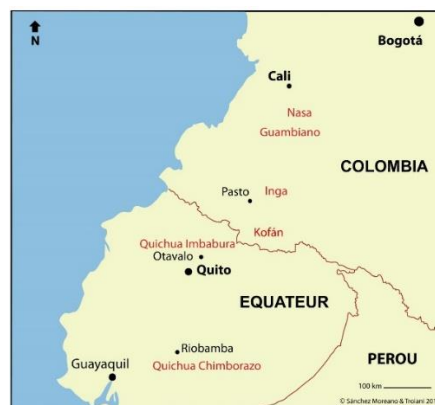
Mapa 1. Lugares de origen de los grupos indígenas de la ciudad de Cali

En Cali, la tercera ciudad más poblada de Colombia (aprox. 1.800.000 habitantes, según el censo de 2018 3 ) y principal polo económico del suroccidente del país, conoce fenómenos de movilidad interna marcados por la presencia de poblaciones indígenas, afrocolombianas y rurales. Según el DANE, en el 2005, el 0,5 % de la población de Cali se reconoce como indígena. Concretamente, en la ciudad hay seis grupos indígenas sociopolíticamente organizados: los nasa, los quichua, los inga, los yanacóna, los kofán y los misak 4 . La mayor parte viene de departamentos vecinos como Chocó, Nariño, Cauca, Putumayo y Huila, pero también de las provincias de Imbabura y Chimborazo en Ecuador (Mapa 1), por lo que la movilidad a Cali también es transnacional.