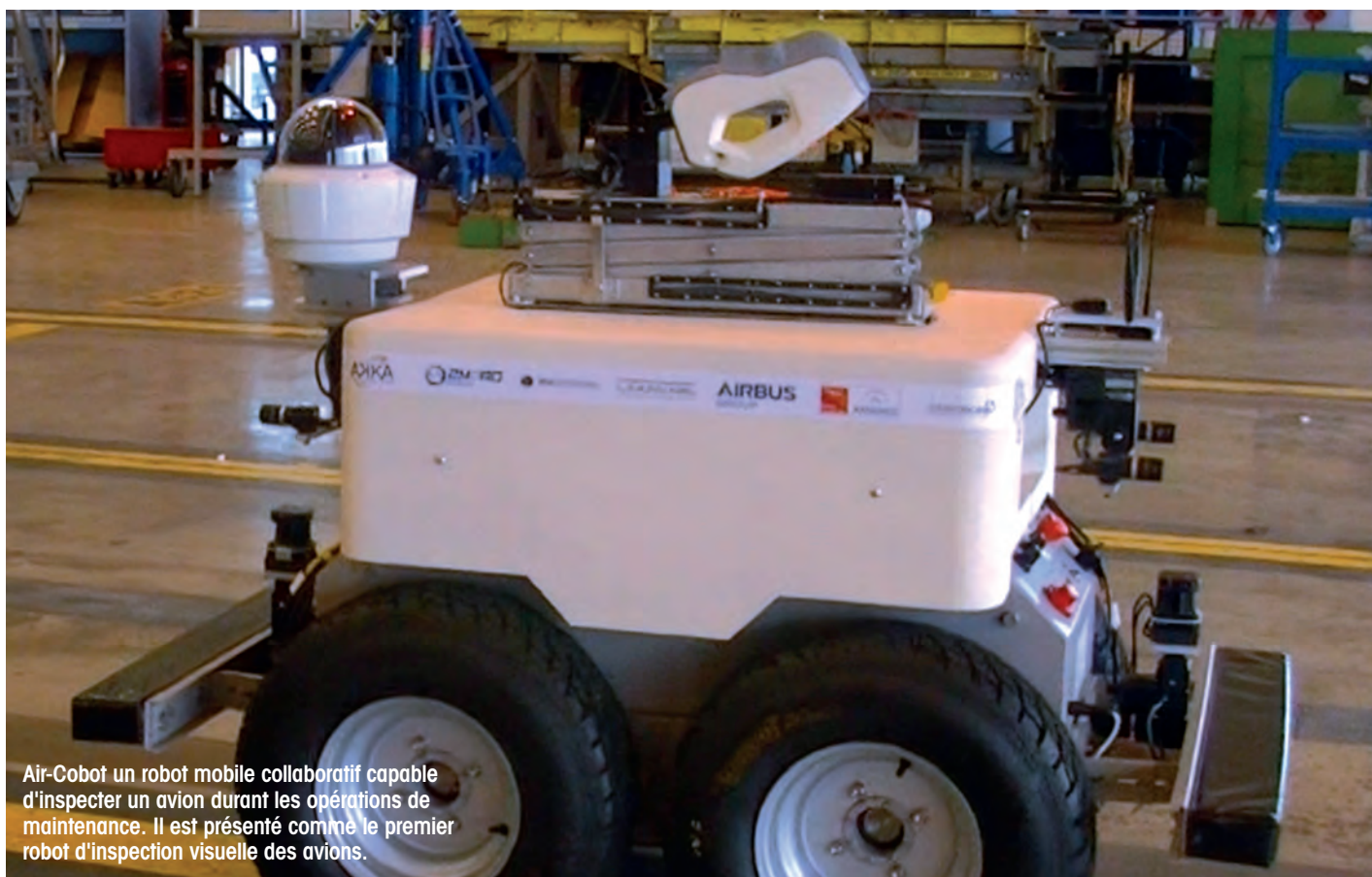
Air-Cobot un robot mobile collaboratif capable d'inspecter un avion durant les opérations de maintenance. Il est présenté comme le premier robot d'inspection visuelle des avions.

du travailleur par le robot. Ce constat est aujourd'hui perçu comme central pour le développement de l'usine du futur, en laissant une place non négligeable à la présence et à l'expertise humaine. Elles sont à la fois un enjeu de compétitivité et un domaine de généralisation en harmonie avec l'attente de consommateurs attentifs à une place préservée de l'humain dans la production des produits et services.