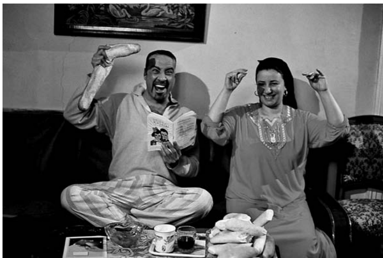
FIGURE 1. Al-Limbî , un film de Wa'il Ihsan (2002).

banlieue de la classe moyenne qui souffrent de conflits filiaux et/ou affectifs. Au contraire, al-Limbî présente un loser de la classe populaire et ses tentatives pour réussir sur les plans économique et affectif. Le film repose donc sur le rêve de mobilité sociale, l'un des ressorts les plus centraux et récurrents du cinéma égyptien depuis les années 1930.