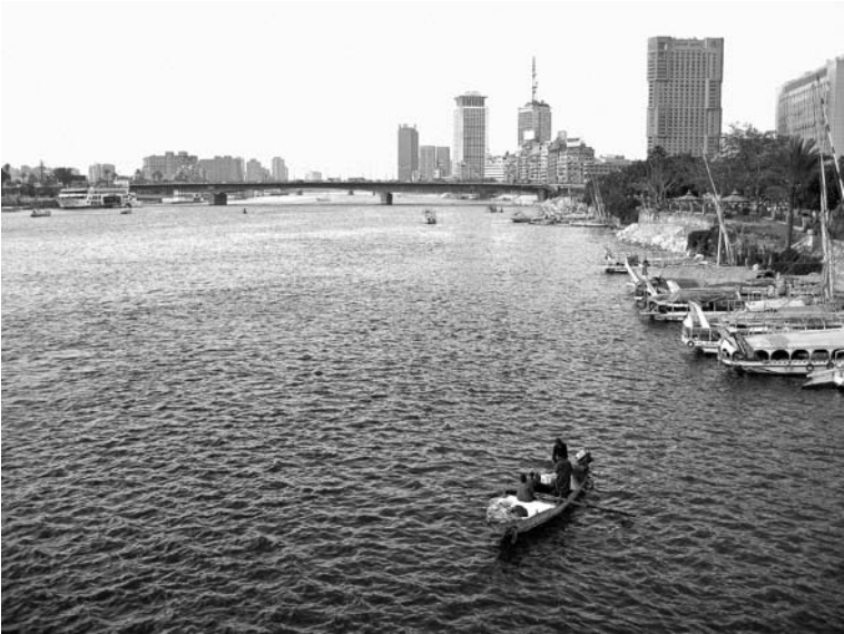
Une barque de pêche sur le Nil, au Caire près du pont Qasr al-Nil.