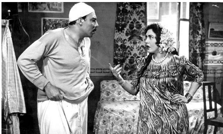
FIGURE 3. Le Costaud , un film de Salah Abou Seif (1957).