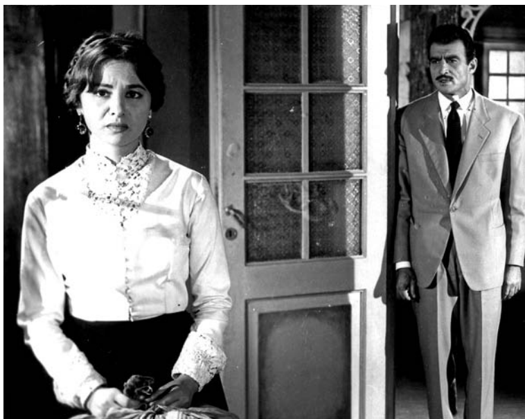
FIGURE 4. La Prière du rossignol , un film de Henri Barakat (1959).