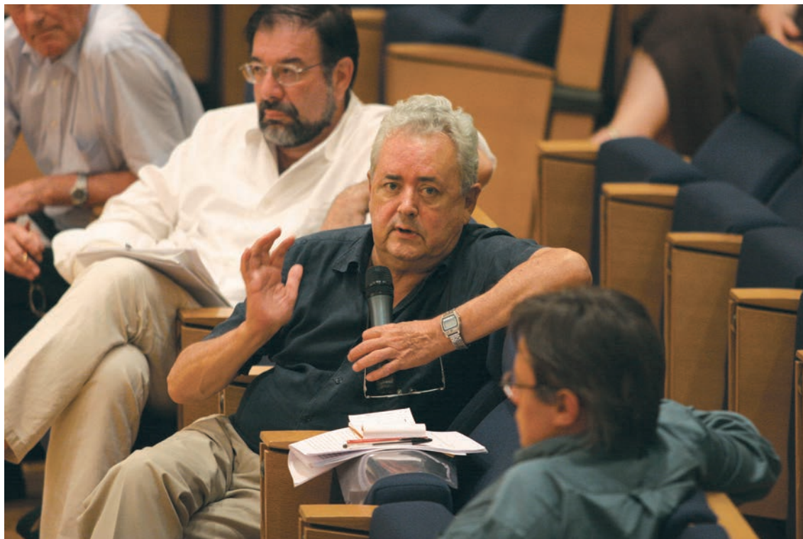
Christian Goudineau lors du colloque de synthèse Celtes et Gaulois, l'archéologie face à l'histoire, Paris, Collège de France, 3-7 juillet 2006.