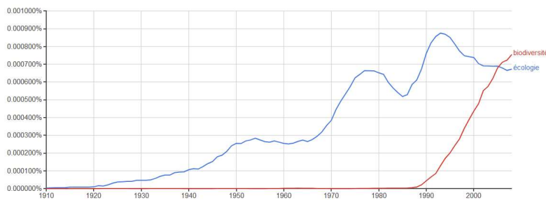
Evolution comparée de la fréquence de « écologie » et « biodiversité »

Cette progression dans la presse s'effectue à la toute fin des années 90 avec un développement qui ne cesse de croître. On peut d'ailleurs s'interroger sur le succès médiatique du concept de « biodiversité » qui pourrait dépasser celui « d'écologie ». C'est ce qu'il est possible d'observer non plus sur un corpus de presse mais via des ouvrages imprimés, notamment avec Ngram viewer 8 :