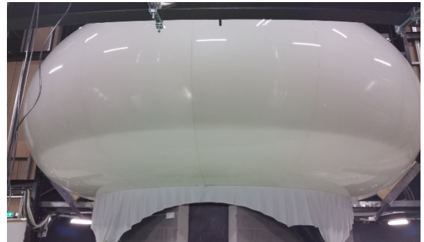
Figure 4: Vue de l'arrière du TORE

Des évaluations formelles permettant de comparer le TORE avec les équipements de forme cubique sont maintenant à mener.