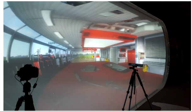
Figure 3: Visualisation d'une scène après calibration

Ces premières constatations nous permettent d'avancer que la forme particulière de l'écran fait perdre toute référence spatiale à l'utilisateur, ce qui est bien l'intention première du projet. On retrouve alors les mêmes sensations d' infini que celles obtenues dans les installations Infinity Environment de l'artiste Doug Wheeler.