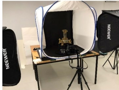
1ère phase : en contexte de lumière naturelle diffuse sous tente lumineuse et flashes à softbox (flashes snods)