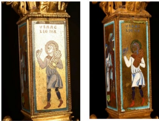
a. Photogrammétrie sous lumière naturelle diffuse ; b. Sous lumière à polarisation croisée