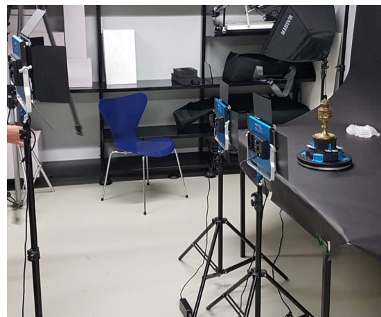
2e phase : en lumière par polarisation croisée, sur fond noir mat (papier cartonné épais) et usage de deux sources lumineuses, l'une directe (leds), l'autre par flashes avec filtres polarisés orientables