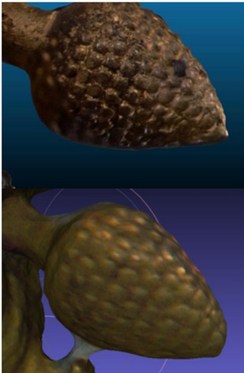
Les niveaux de détail (fruit grenu du pied de croix, ca. L. 10 x D. max. 9 mm)

Ainsi le processus d'acquisition par photogrammétrie, qui devait respecter à la fois l'objectif de maîtrise des coûts et celui du respect des couleurs « réelles », s'est fait en deux phases (mars et août 2019) 21 : la première dans un contexte de lumière naturelle diffuse, avec usage d'une tente lumineuse et de flashes snods (ou dit aussi softbox) ( fig. 5 ), la seconde étape avec une lumière par polarisation croisée, sans tente et sur fond neutre noir et avec deux sources lumineuses, l'une permanente (leds), l'autre par flashes avec filtres orientables, pour un meilleur contrôle directionnel de la lumière polarisée ( fig. 6 ) 22 . L'usage d'un nuancier a permis de calibrer et de contrôler les couleurs d'une phase à l'autre. Sous lumière polarisée, les couleurs apparaissent plus contrastées que sous lumière naturelle diffuse ( fig. 7 ) 23 .