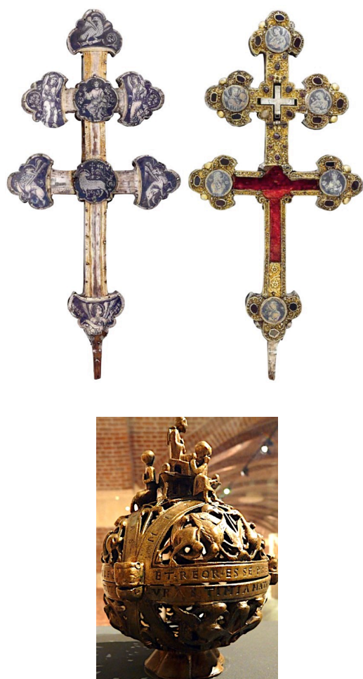
Croix de Wasnes-au-Bac (38,4 x 17,9 cm); Encensoir au Hébreux (16 x 10,4 cm)

Leur étude et leur numérisation sont donc un enjeu patrimonial de conservation des œuvres dont l'une, la croix-reliquaire de