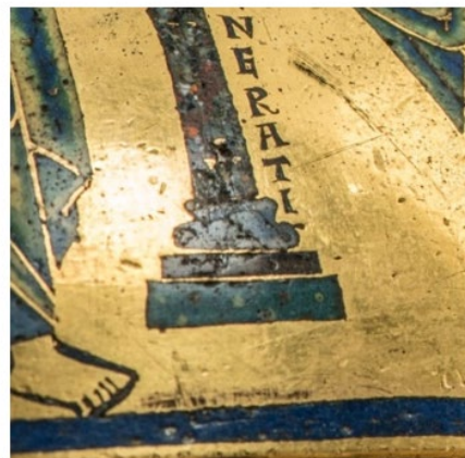
Détail du pied de croix de St-Bertin