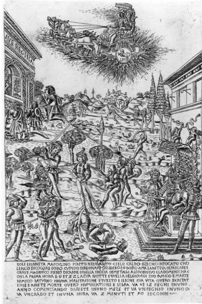
Planche III. Le soleil et ses enfants. Gravure florentine attribuée à Baccio Baldini, vers 1460. Londres, British Museum.