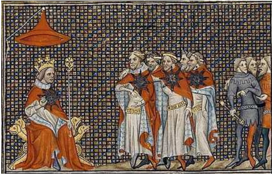
Planche I. L'ordre de l'Étoile, dans l'exemplaire commandé par Charles V des Grandes Chroniques de France (vers 1375-1377). Paris, BNF, ms fr. 2813, fol. 394.