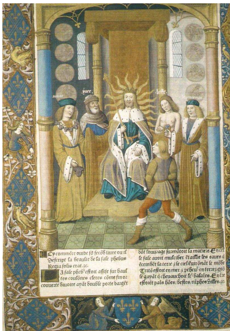
Planche VII. La salle du trône du roi Phébus. Exempleire de Charles VIII de la Bible des poetes , enluminé par le Maître de Jacques de Besançon, éd. Paris, Antoine Vérard, 1494. Paris, BNF, Rés. Vélin 559, fol. 12.