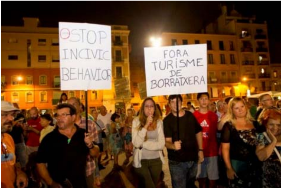
Figure 2. Manifestation de résidents de la Barceloneta contre le "tourisme d'ivresse" à Barcelone, Giordano, 2016.

48 Cependant, ces études restent limitées à un nombre réduit de contextes empiriques, principalement les villes de Lisbonne et Barcelone. Certaines des questions potentielles liées à ces thématiques restent ouvertes : quels sont les impacts différenciés de la touristification de la nuit urbaine sur les populations urbaines ? Quels sont les impacts sur les communautés locales ? Quel genre de rencontres et / ou de tensions surgissent entre les touristes et les résidents ?