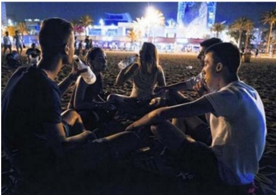
Figure 1. Plage de la Barceloneta à Barcelone, Nofre, 2015.

47 Dans plusieurs villes, les protestations contre le « tourisme d’ivresse » sont devenues une cause fréquente de manifestation des résidents contre les impacts du tourisme, montrant comment la touristification de la vie nocturne est devenue un élément essentiel pour comprendre la perception de la perte de leur qualité de vie par les résidents de nombreux quartiers touristiques (Colomb et Novy, 2016). Ainsi des études