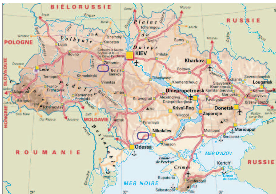
Figure 1 - Carte de situation des régions étudiées