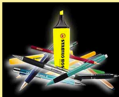
Figure 1 - Le Stabilo Boss 28

La réussite du STABILO BOSS repose avant tout sur une technologie brillante d'ingéniosité : une encre fluorescente possédant des caractéristiques complètement inconnues jusqu'alors. Pour la première fois, il suffit de surligner ou de souligner les passages importants d'un texte à l'aide de la pointe biseautée du BOSS... pour qu'instantanément, ceux-ci sautent aux yeux avec une clarté lumineuse !