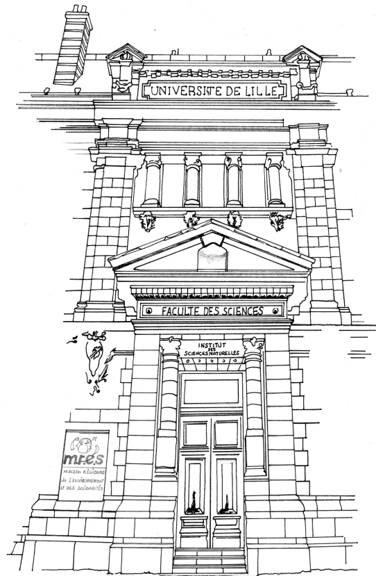
Fig. 1. – Photographie et schéma de l'entrée de l'ancienne Faculté des Sciences de Lille, rue Gosselet à Lille. Cliché et dessin de Pascal Debleeckere & Livio Samounadsing - Musée d'histoire naturelle de Lille.