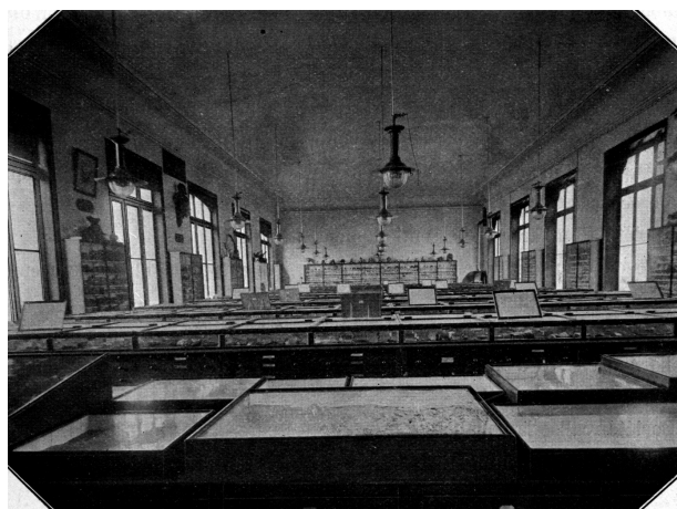
Fig. 2. – Musée Gosselet, salle régionale du Musée de Géologie et de Minéralogie de Lille ; actuellement salle principale des réserves des collections de géologie.

Le fonds ancien est alors pratiquement constitué. Aujourd'hui, la disposition de ces salles a peu changé. La première salle est restée la principale salle des réserves et est dénommée « Musée Gosselet ». Elle est constituée d'1 meuble de 16 colonnes de 7 tiroirs et 11 meubles de 24 colonnes, comprenant chacune 8 tiroirs et 1 vitrine ; le long des murs, 15 vitrines-colonnes de 10 à 14 étagères conservent les échantillons de minéralogie. La salle de géologie générale, dénommée « Petit Musée », abrite les échantillons extra-régionaux des collections, répartis dans 1 meuble de 24 colonnes et 2 meubles de 28 colonnes, chaque colonne comprenant 7 tiroirs et 1 vitrine, ainsi que 4 vitrines murales de 10 à 15 étagères et 10 colonnes murales de 24 tiroirs. Le 24 avril 1903, la Ville de Lille, estimant que la richesse des collections mérite l'administration de deux conservateurs, nomme Paul Hallez en zoologie et Charles Barrois en géologie, en remplacement de Jules Gosselet. Avec cette nomination, une discipline supplémentaire va accroître la richesse et la diversité