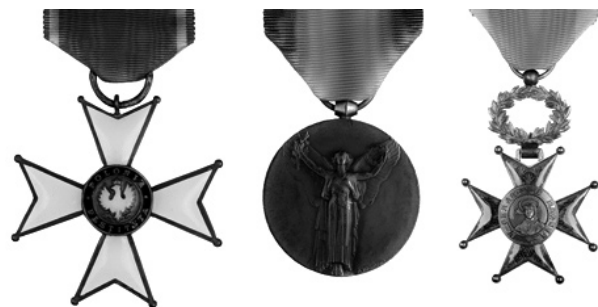
Fig. 9. – Médailles décernées à Félix Broussier à la fin de sa vie ; respectivement de gauche à droite, l'Ordre de la Polonia Restituta, la Médaille Interalliée de la Victoire, et Chevalier de l'Ordre de St-Grégoire-le-Grand (« Légion d'Honneur » du Vatican).

Fig.9. – Medals awarded to Félix Broussier at the end of his life, respectively from left to right, the Order of Polonia Restituta, the Inter-Allied Victory Medal, and Knight of the Order of St. Gregory-the-Great.