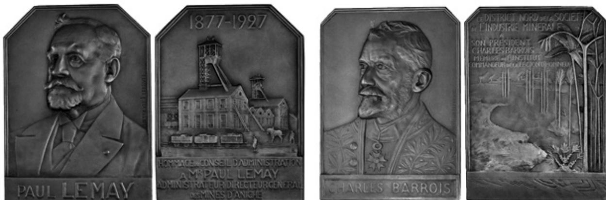
Fig. 6. – Médailles commémoratives émises, respectivement, par la Société de l’Industrie Minérale et la Compagnie des mines d’Aniche en hommage à Paul Lemay (à gauche) et Charles Barrois (à droite) – Crédit photographique Marie Hennion.