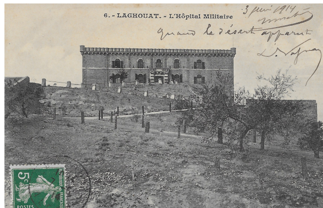
Figure 2 : l'hôpital militaire de Laghouat. Carte postale ancienne, collection de l'auteur.

Il ne reste pas longtemps à Montpellier, où il a été promu à la 1 e classe le 31 décembre 1871. En effet, dans les années qui suivent le conflit de 1870, les changements de garnison des unités et les mutations des personnels sont fréquentes. L'Algérie continue d'occuper beaucoup de personnels du Service de santé militaire. Aussi Burcker rejoint-il les hôpitaux de la division d'Alger : l'hôpital de Laghouat 25 le 17 novembre 1872 (figure 2, 5 e classe, 100 lits en 1874). Il revient en France le 12 février 1874 aux ambulances du camp d'Avor (figure 3, aujourd'hui Avord, que la liste de 1874 ne connaît pas) 26 qui servent pour les élèves de l'École militaire qui y stationne depuis 1873, et sans doute beaucoup à l'occasion des manœuvres. C'est là qu'il est promu pharmacien-major de 2 e classe (capitaine) le 24 décembre 1874.