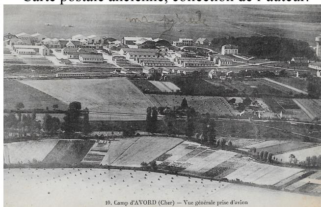
Figure 3 : le camp militaire d'Avord, sans doute au début du XX e siècle. Carte postale ancienne.