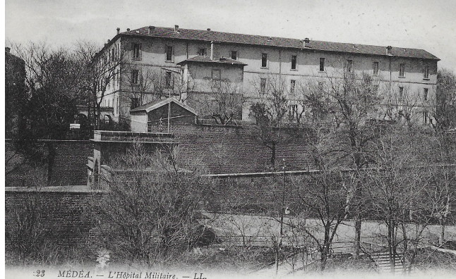
Figure 5 : l'hôpital militaire de Médéah. Carte postale ancienne, collection de l'auteur.