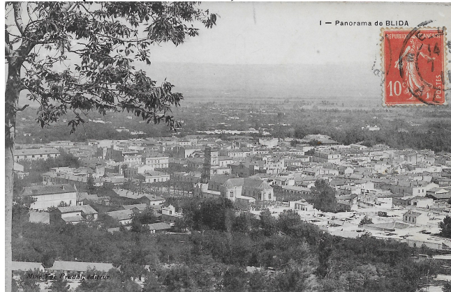
Figure 6 : vue de Blida. Carte postale ancienne, collection de l'auteur.