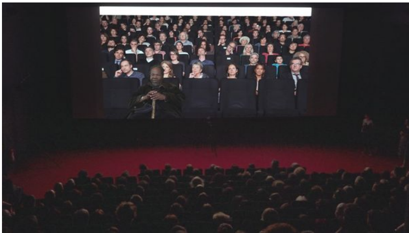
L'autre de l'autre à l'ouverture du festival Côté court 2017

En général, le travail de l'artiste qui propose Interface malicieuse , s'appuie principalement sur l'image du public, qui, projetée en direct, joue le rôle d'un miroir collectif 2 . Avec ce type de dispositif, le public modifie l'image par sa présence et non par une action délibérée sur le système informatique, celui-ci se comportant simplement comme un filtre ; le public ne pouvant modifier ce filtre, on ne peut pas parler d'interactivité 3 au sens strict, et c'est un choix assumé, car nous pensons que l'interactivité stricte nous prive du plaisir passif que procure une œuvre linéaire.