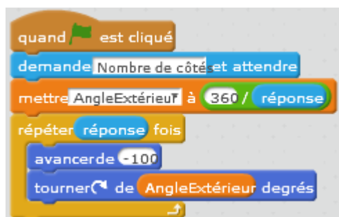
FIGURE 1. Programme Scratch de trajectoire polygonale

Fonctionnement "générique" d'un capteur. On donne la documentation du capteur de lumière dans un tableau similaire à celui du capteur de son (cf. table 1) et on demande de faire "dire" au robot si la luminosité ambiante est claire ou sombre. Certains enfants font la relation avec le programme du capteur de son et réutilisent ce programme sans aide. Se représenter que la lumière est une vague (une onde) comparable au son permettrait d'établir des parallèles fructueux entre l'amplitude, l'intensité d'un son et la luminosité. De même la fréquence d'une note pourrait être fructueusement comparée à la couleur.