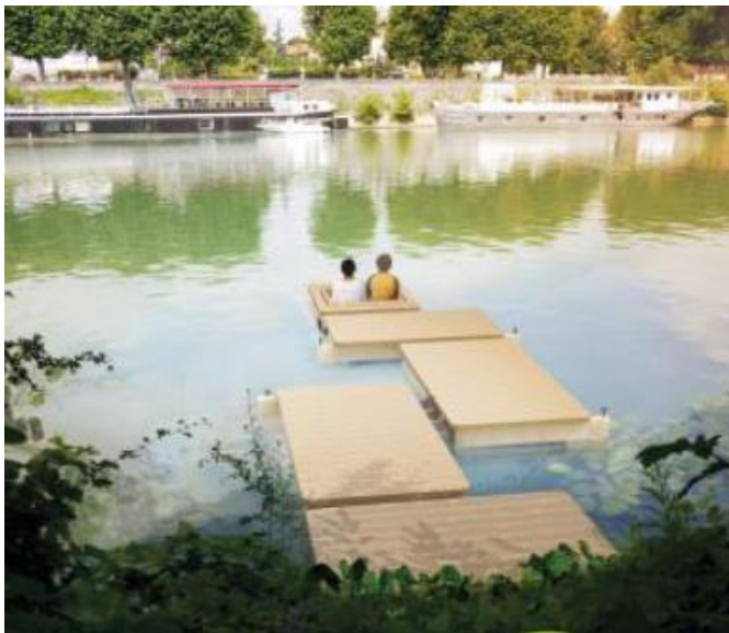
Figure 5. Croquis d'un ponton dans l'eau réalisé par La Fabrique de l'Est à L'île-Saint-Denis, dans le cadre de la recherche FACT, 2016.