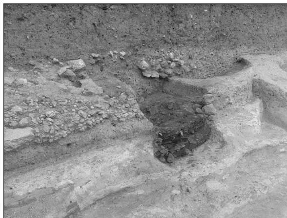
Fig. 2 : Vue en coupe vers le sud-ouest de la fosse 13.

A ce stade encore provisoire de l'étude, les quatre strates principales comblant la fosse recèlent de manière indifférenciée des fragments appartenant aux mêmes poteries souvent complètes, si bien que nous avons opéré le regroupement du mobilier recueilli dans les différentes couches au sein d'un même ensemble chrono-stratigraphique. Cette dispersion stratigraphique dans la fosse et l'homogénéité des objets permettent de conclure à un comblement rapide de la structure, à l'aide de sédiments, d'éléments organiques et de céramiques issus d'une zone d'habitat domestique très proche, qui a dû subir une destruction antérieure par le feu.