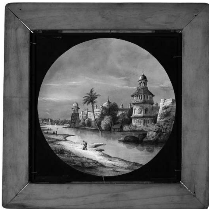
Palais royal à Delhi, plaque de verre peinte à la main, milieu du XIX e siècle, Royal Polytechnic Institution (collection de la Cinémathèque française)