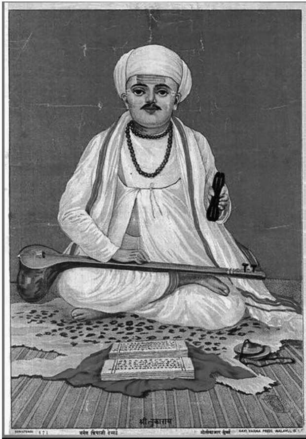
Sant Tukaram par Raja Ravi Varma, XIX e siècle, Baroda Art Gallery