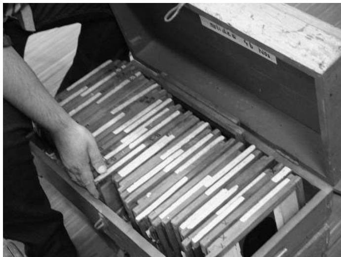
Boîte en bois contenant les plaques de lanterne, NFAI, décembre 2016

L'histoire de cette lanterne (dont la période d'exploitation irait selon les descendants de 1892 à 1918) se superpose avec l'arrivée et l'avènement du cinéma en Inde. C'est aussi, et cet aspect est crucial, un objet de la culture