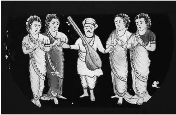
Plaque non datée et non signée