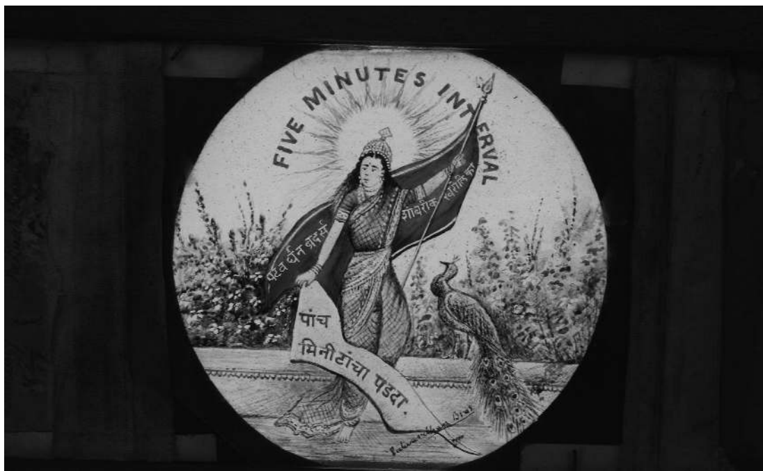
Plaque d'entracte non datée et non signée, fonds Patwardhan

Enfin, des plaques d'une autre nature permettent de retracer l'organisation et le déroulé d'un spectacle de cette lanterne. Le fonds contient des plaques de titres, une annonce d'entracte bilingue anglais-marathi ou une autre pour signaler la fin du spectacle. Plusieurs plaques animées mettent en avant le nom de « Patwardhan Brothers », avec les lettres changeant de couleur au-dessus de la tête de danseuses. Si la plupart sont écrites en marathi, l'une représentant deux tigres annonce « God save the King and the Queen ». Une plaque avec les noms des musiciens et des chanteurs est sûrement liée à une plaque montrant des musiciens, peut-être à la façon d'un générique.