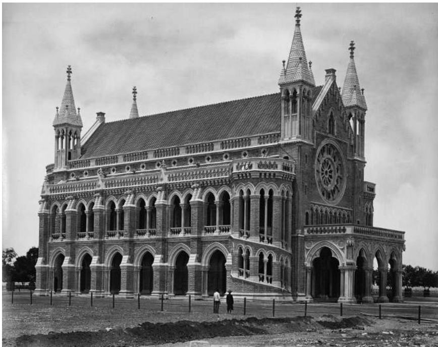
L'Université de Bombay dans les années 1870