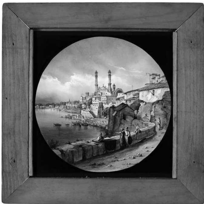
Temple hindou à Benares, plaque de verre peinte à la main, milieu du XIX e siècle, Royal Polytechnic Institution (collection de la Cinémathèque française)