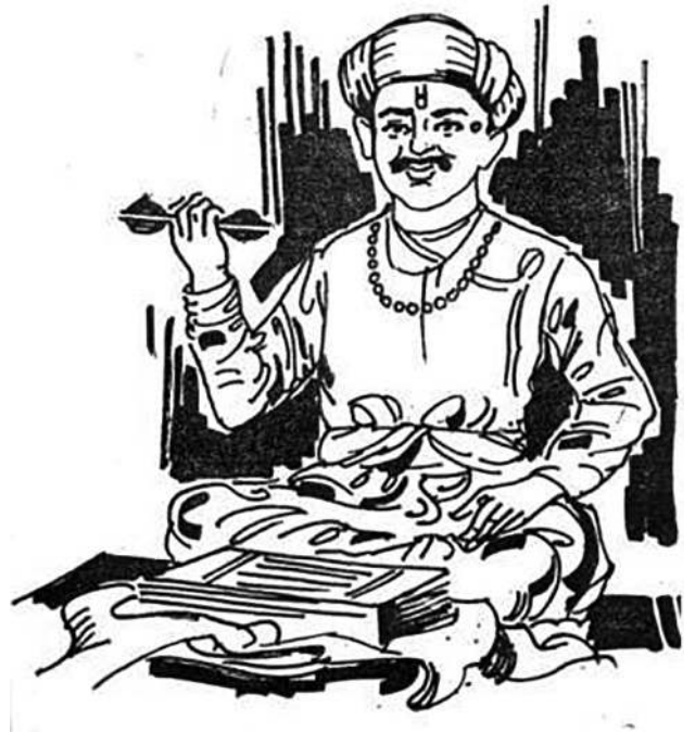
Illustration de Satyajit Ray pour la couverture du livre Tukaram de B. Nemade, 1980