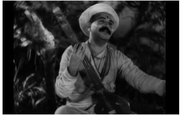
Sant Tukaram (Damle et Fattelal, 1936)