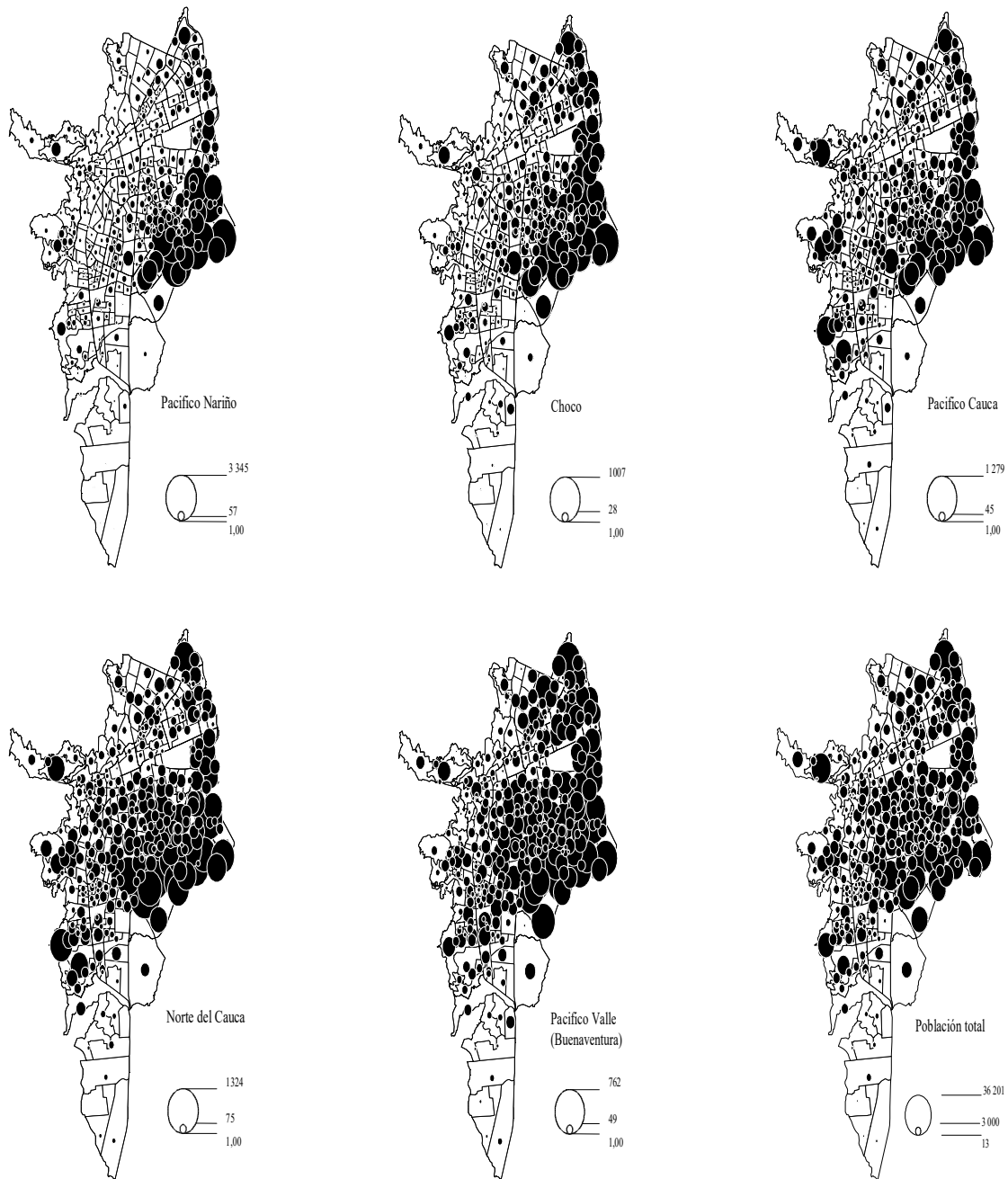
Gráfica 3: Distribución de la población por sector cartográfico según lugar de origen

DANE Censo 1993 - Olivier Pissot & Olivier Barbary